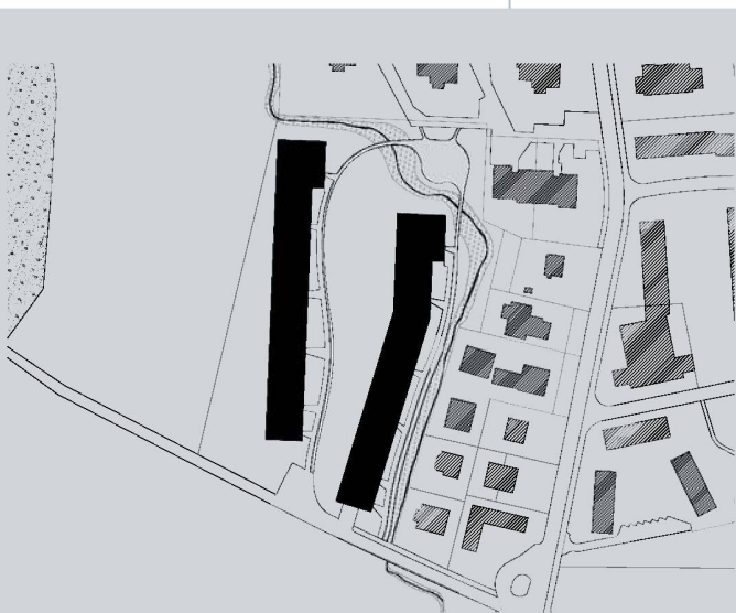
Die zwei langgezogenen Baukörper liegen am Siedlungsrand in Zürich Seebach.

Auch die Materialisierung der baulichen Hülle entspricht einem hohen Standard. Tragende Wände sind in Ortbeton und Mauerwerk ausgeführt, die Fassadenelemente hinter der äusseren Aluminiumverkleidung sind hochisolierende Holzelemen-