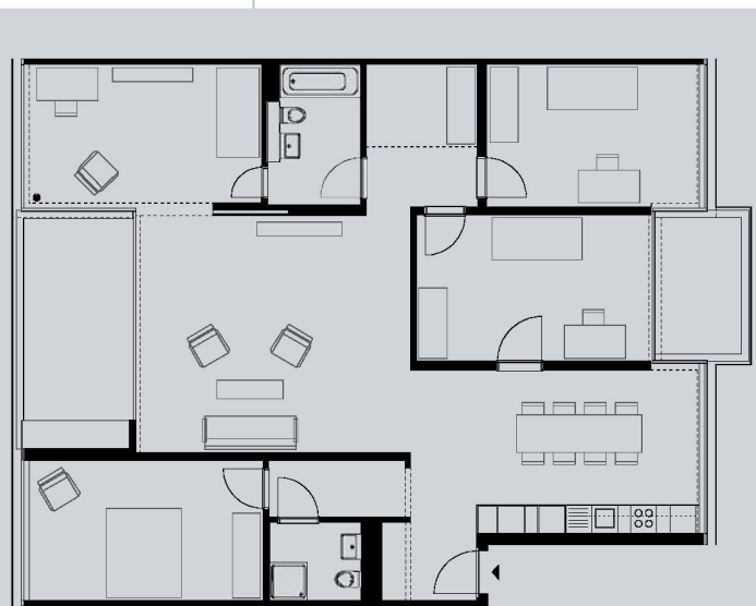
Grundriss einer Fünfeinhalbzimmerwohnung, die das Konzept des Zimmers mit zwei Türen zeigt.