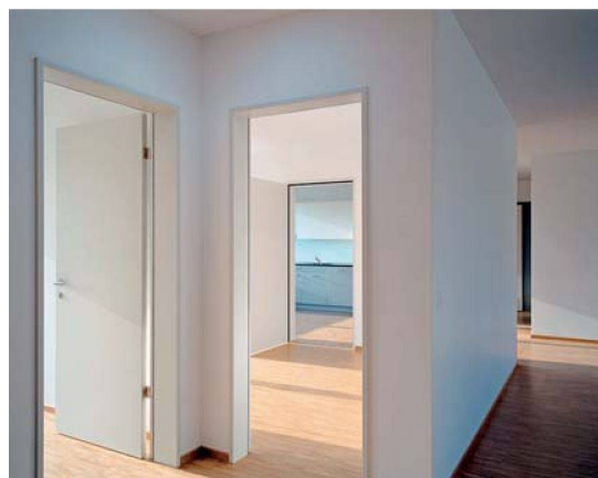
Dank Türen gegen Flur und Küche eröffnen sich für diesen Raum verschiedene Nutzungsmöglichkeiten.

te. Die Fenster sind Holz-Metall-Konstruktionen mit raumhoher Verglasung bei den Balkonen und Loggien. Markisen und Rafflamellenstoren dienen als Sonnen- und Sichtschutz.