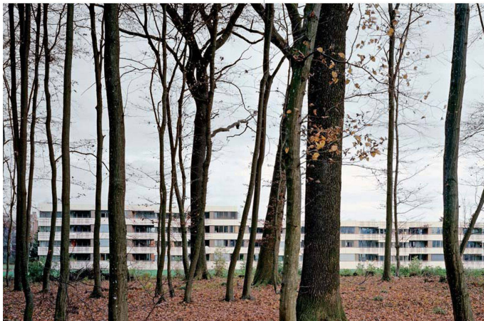
Keine 08/15-Architektur: Die Seidlung Stähelimmatt vom nahen Wald gesehen.