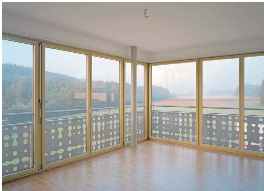
Hohe räumliche Qualität: Blick in ein Wohnzimmer.