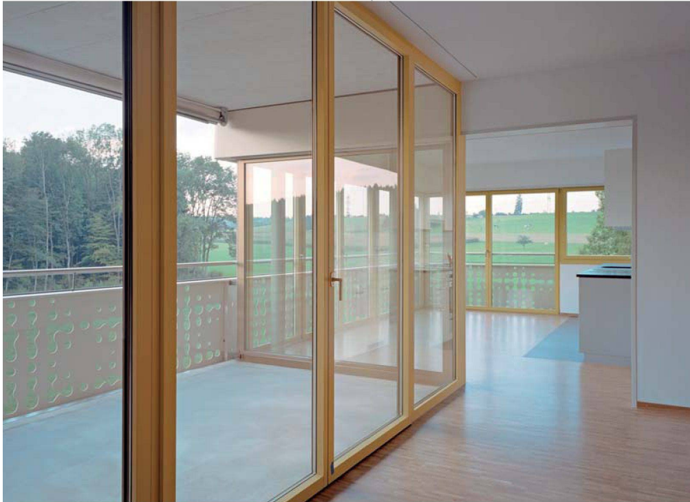
Die Wohnungen im Gebäude der Baugenossenschaft Schönau bieten Ausblick auf die freie Landschaft.

dass es in derselben Wohnung Zimmer mit unterschiedlicher Atmosphäre gebe, was den verschiedenen Bedürfnissen der möglichen Bewohnerschaft entgegenkomme.