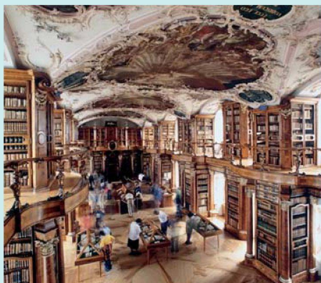
Unter anderem auf dem Programm am Nachmittag: Eine Besichtigung der Kathedrale und Stiftsbibliothek von St. Gallen, die zum Unesco-Weltkulturerbe gehört.

Der diesjährige Verbandstag findet in St. Gallen statt.