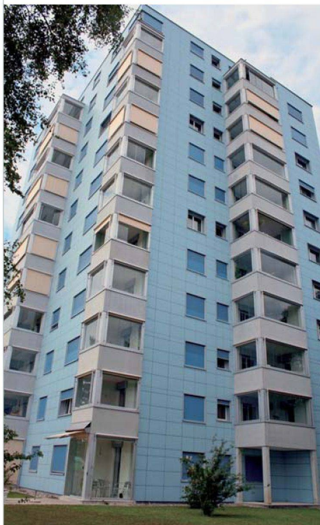
Die SILU besitzt rund um den Flughafen 900 Wohnungen. Im Bild Siedlungen in Bachenbülach und Bassersdorf.