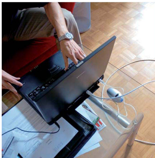
Während früher ein Rediffusionsanschluss genügte, müssen die Wohnungen heute für «Triple Play» – für Telefon, schnelles Internet und Fernsehen über dasselbe Netz gerüstet sein.

diendienste im Bereich TV, Radio, Telefonie, Internet usw. einspeisen können.