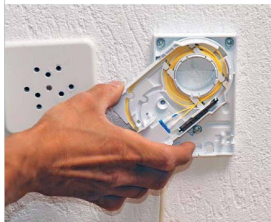
Welche Anschlüsse braucht es, damit die Liegenschaften für die künftige technologische Entwicklung bereit sind?

Wie diese Zukunft aussieht, wird sich zeigen. Während noch vor wenigen Jahren ein Rediffusionsanschluss und eine Telefonbuchse in einer Mietwohnung vollends ausreichten, gehören heute ISDN-Telefon, leistungsfähiges Internet und wohl auch bald Digital- und HD-Fernsehen zum Standard. Über ein sogenanntes «Converged Triple Play»-Breitbandnetz sind aber künftig neben Fernsehen, Radio und Internet noch viele weitere Multimediadienstleistungen denkbar, etwa Spiele, E-Learning, Videoüberwachung oder Facility Management. Das Thema der richtigen Hausinfrastruktur wird die Baugenossenschaften also bestimmt noch eine Weile beschäftigen. ☺