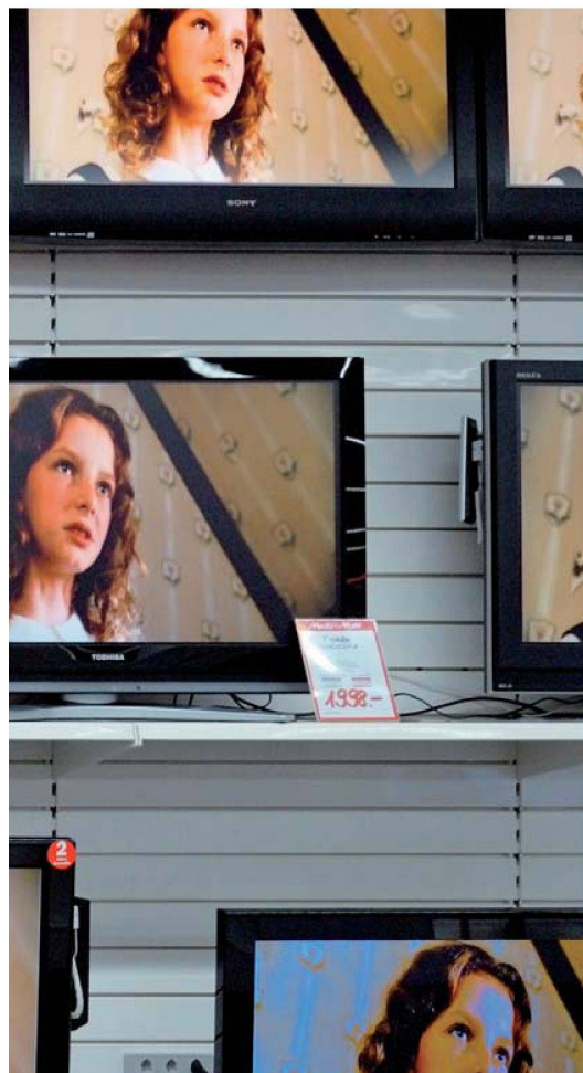
Welche Alternativen gibt es zur Cablecom? Der Angebotsdchungel im TV-Bereich macht es für die Liegenschaftsbesitzer nicht einfach.

neben Telefon- und Internetdiensten auch TV anbietet. Unterdessen hat sich ausserdem die Swisscom eingeschaltet und dazu aufgerufen, sich schweizweit über den Bau von Glasfaserkabeln abzusprechen und jeweils gleich vier Fasern zu integrieren.