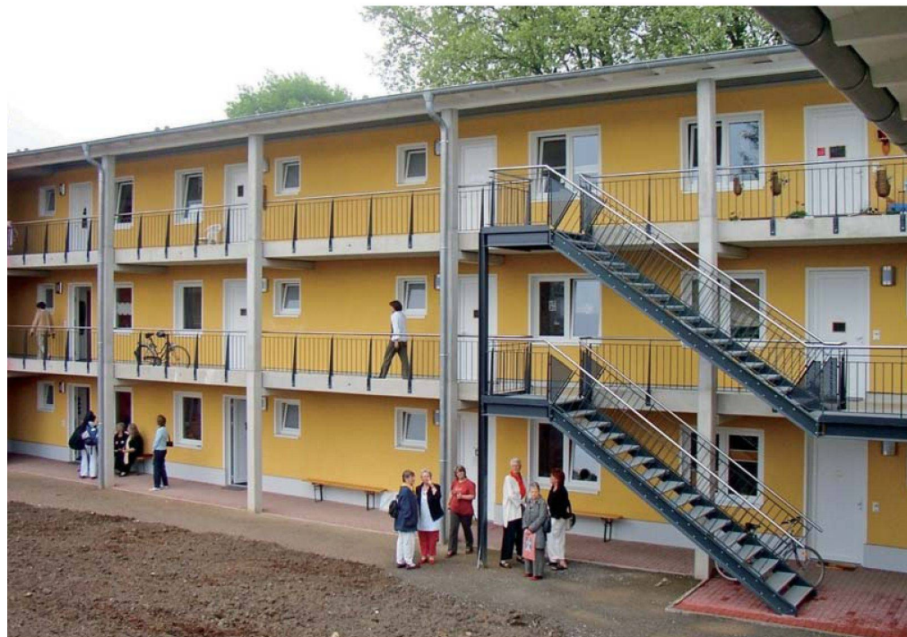
Beim Projekt Begienhöfe schafft eine Dachgenossenschaft in Nordrhein-Westfalen gezielt Wohnraum für Frauen.