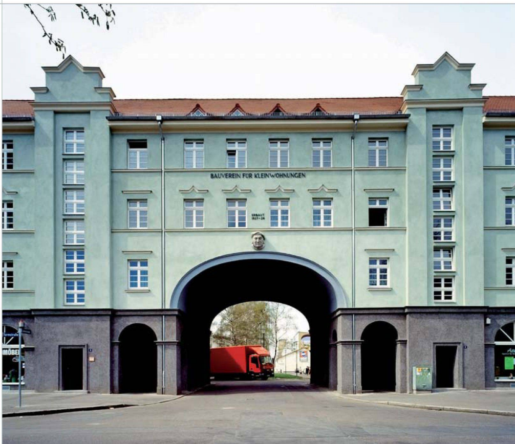
Der Bauverein Halle, der von enormen Leerständen betroffen ist, schafft mit einem Familienzentrum und einer Reihe weiterer Massnahmen neues Leben im Lutherviertel.

Es knüpft an die historische Tradition des genossenschaftlichen Wohnungsbaus an, aber auch an verschiedenste neuere und innovative Praxiserfahrungen sowie, nicht zuletzt, an ein aktuelles gesellschaftspolitisches Interesse (Stichwort: Veräusserung kommunaler Wohnungsbestände). Aus diesem Grund geht es auch nicht um die Erfindung von etwas völlig Neuem. Vielmehr heisst es zu prüfen, mit welchen recht-