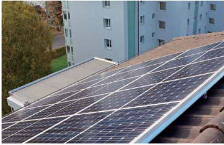
Die GWG gehört zu den ersten Bauträgern, die von der Einspeisevergütung für Solarstrom profitieren können.

den. Die Abwärme aus der Abfallverbrennung wird in der Stadt Winterthur genutzt: Sie fliesst in Form von Dampf oder warmem Wasser in ein weit verzweigtes Wärmenetz und steht einer wachsenden Zahl von Liegenschaftsbesitzern zur Verfügung – als kostengünstiger und CO 2 -armer Energieträger. Bei der GWG-Siedlung gab der anstehende Heizungsersatz den Anstoss zum Wechsel: Statt mit Heizöl wird das Mehrfamilienhaus neuerdings mit Fernwärme versorgt. Diese Energiequelle ist zudem derart ergiebig, dass die KVA-Abwärme sowohl für das Beheizen der Wohnungen als auch für das Erwärmen der Wasserboiler genutzt werden kann.