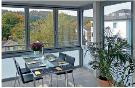
Mehr Wohnkomfort dank dem neuen verglasten Balkon.

den. Die Abwärme aus der Abfallverbrennung wird in der Stadt Winterthur genutzt: Sie fliesst in Form von Dampf oder warmem Wasser in ein weit verzweigtes Wärmenetz und steht einer wachsenden Zahl von Liegenschaftsbesitzern zur Verfügung – als kostengünstiger und CO 2 -armer Energieträger. Bei der GWG-Siedlung gab der anstehende Heizungsersatz den Anstoss zum Wechsel: Statt mit Heizöl wird das Mehrfamilienhaus neuerdings mit Fernwärme versorgt. Diese Energiequelle ist zudem derart ergiebig, dass die KVA-Abwärme sowohl für das Beheizen der Wohnungen als auch für das Erwärmen der Wasserboiler genutzt werden kann.