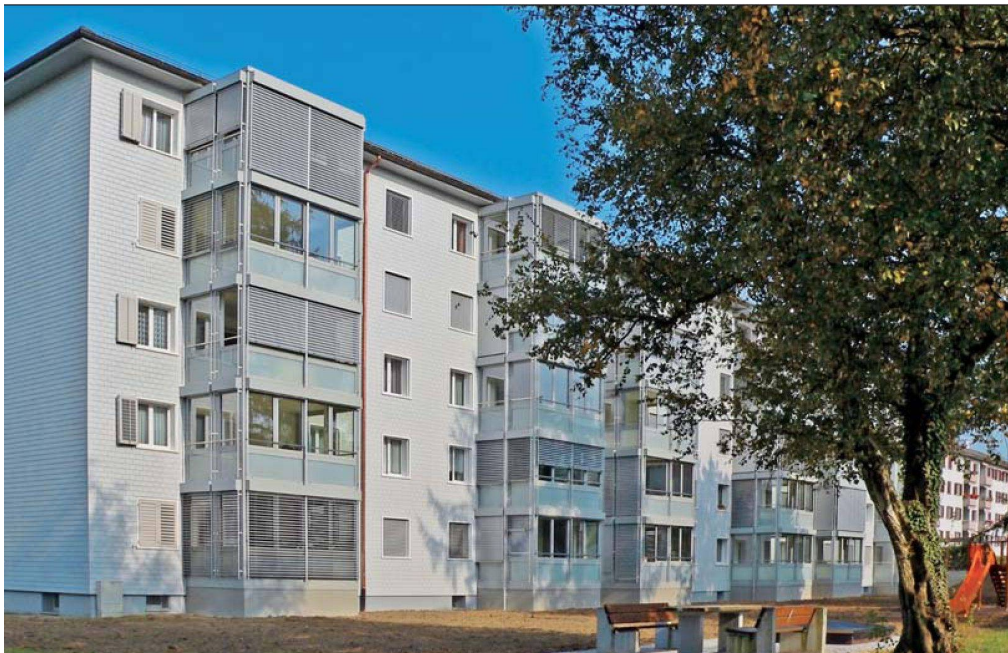
Die Südfassade erhielt eine neue Verkleidung und verglaste Balkone (klein: früherer Zustand).