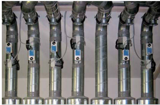
Im Dachstock wurde ein Technikraum für die zentrale Lüftungsanlage eingerichtet.