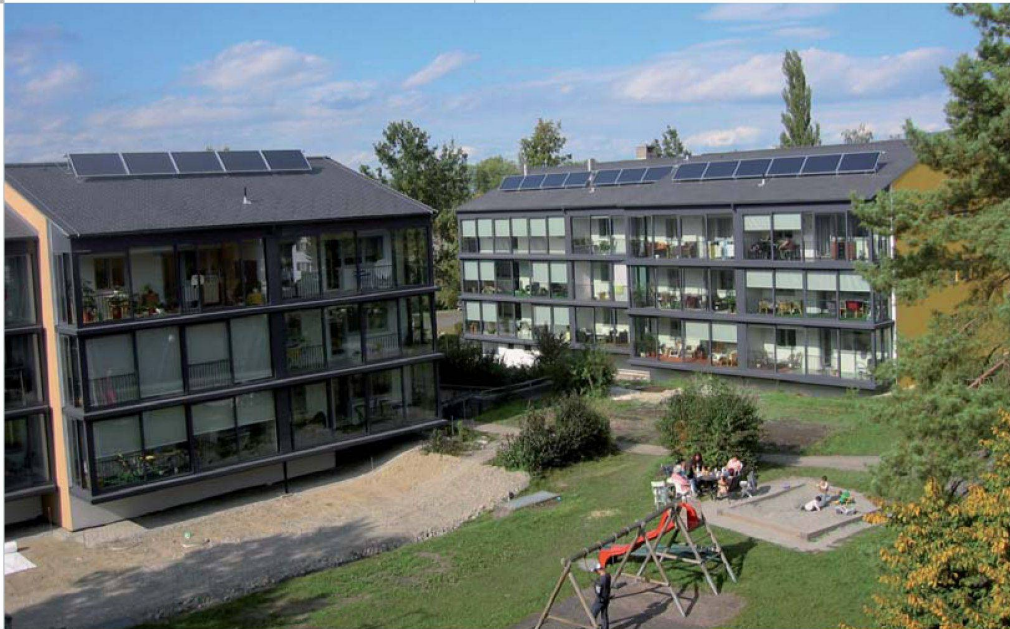
Die Siedlung Fussenuau kurz vor Abschluss der Sanierung im Sommer 2009: Mit ihren verglasten Balkonen und der neuen Fassade kommen die Gebäude wie Neubauten daher – und bieten auch solche Energiewerte.