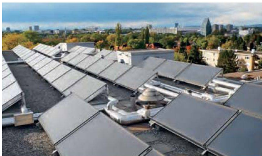
Die Solaranlage zur Warmwasseraufbereitung bedeckt eine Dachfläche von 200 Quadratmetern.