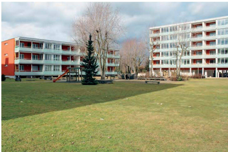
Der parkähnliche Aussenraum der fünf Bauten blieb erhalten.

als die Hälfte des Bestandes aus. Hinzu kamen Probleme mit den Backsteinfassaden, die auch energetisch nicht mehr genügten. Die Steine platzten nämlich mehr und mehr ab, in den Rissen sammelte sich die Nässe. Dadurch gelangte Feuchtigkeit in die Wohnungen. Im Winter litt die Fassade besonders stark, da ihr das gefrorene Nass dann überdurchschnittlich zusetzte.