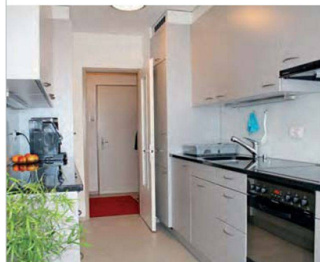
Die neue Küche räumt mit den engen Verhältnissen auf.