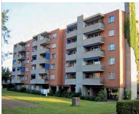
Hochhaus im früheren Zustand.