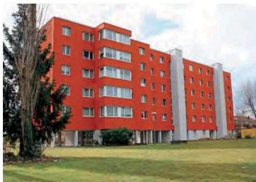
Die beiden Hochhäuser erhielten Küchenanbauten (links).