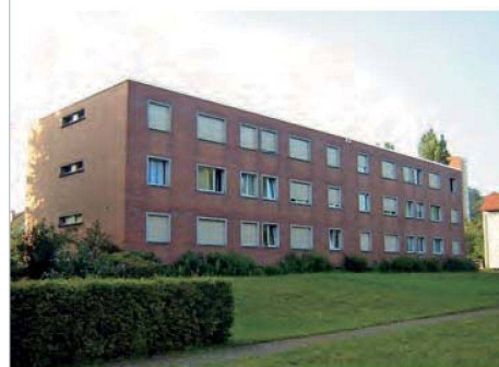
Früherer Zustand: Die schmucklosen Backsteinhäuser wurden zu rasch und billig gebaut.