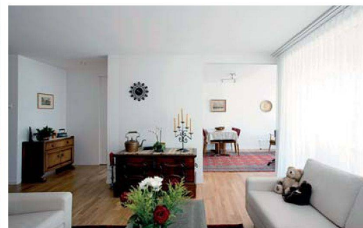
Blick ins Wohnzimmer einer 3½-Zimmer-Wohnung.