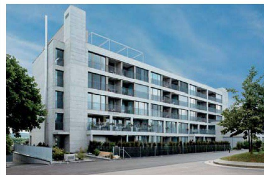
Auf der Südwestseite, die gegen den ruhigen Dorfplatz ausgerichtet ist, besitzt jede Wohnung eine Loggia.