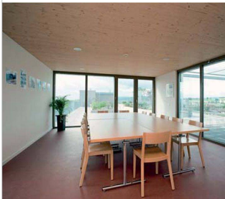
Die Dachterrasse lädt zum Verweilen und Spazieren ein. Hier befindet sich auch ein Pavillon mit einem Gemeinschaftsraum.