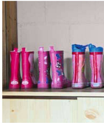
Wohnglück ist: Platz für die Drillinge haben