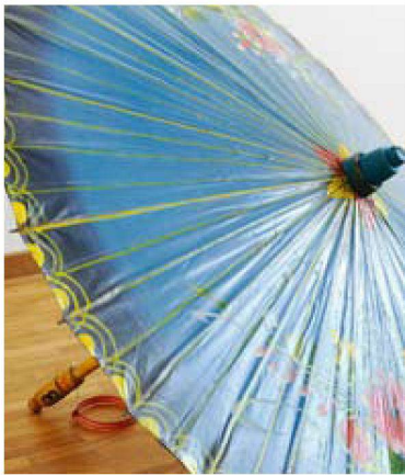
Wohnglück ist: Erinnerungen an schöne Reisen