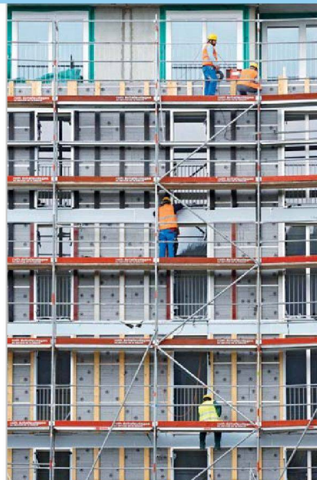
Motor für die Baukonjunktur: Neubau von Mietwohnungen.

Unbeeindruckt vom Konjunkturreinbruch hat sich in den letzten zwei Jahren der Schweizer Baumarkt entwickelt. Nach wie vor ist es der Wohnungsneubau, der die Baukonjunktur in Schwung hält. Das Volumen der hängigen Baugesuche deutet darauf hin, dass sich diese Entwicklung mindestens bis Mitte 2011 fortsetzen wird. Dabei rechnen Wüest & Partner damit, dass das Neubauvolumen bei den Mehrfamilienhäusern 2011 noch um 0,2 Prozent zulegt, während dasjenige von Einfamilienhäusern um 0,8 Prozent abnimmt. Beim Umbau, auf den rund ein Drittel des Investitionsniveaus fällt, rechnen die Fachleute mit einem deutlichen Plus (3,1 Prozent bei den EFH, 3,4