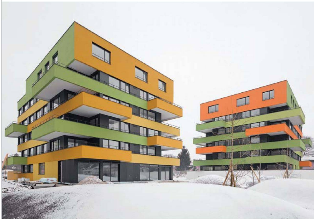
Die beiden vollendeten Punktbauten der ersten Etappe: Spiel der verschachtelten Balkone.