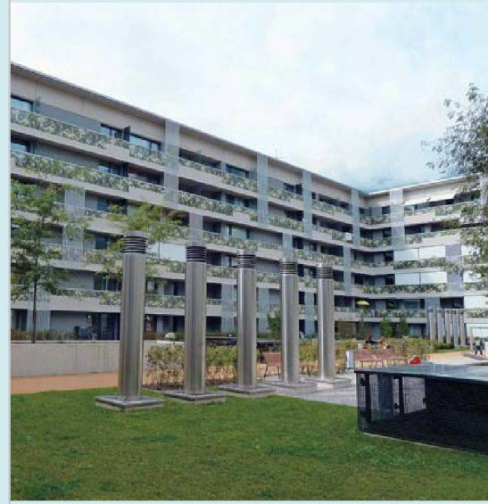
Passivhaus Lodenareal: Mit 354 Wohnungen die zurzeit grösste Passivhaus-Siedlung Europas.

widmeten sich auch der Frage, ob das Passivhaus zu einem Standard des gemeinnützigen Wohnbaus wird. Die Meinungen darüber waren geteilt. Zwar war man sich mehrheitlich einig, dass sich die Mehrkosten für den Passivhausstandard langfristig auszahlen, gleichzeitig war heftig umstritten, ob es sich lohnt, Altbauten auf diesen Standard zu sanieren, sind doch die Kosten dafür teilweise sehr hoch. Zur Energieeffizienz tragen aber nicht nur die Bauten selbst, sondern auch das Nutzerverhalten und die Stadtplanung bei, so ein anderes Argument. Das Fazit der Veranstaltung: Die gemeinnützigen Bauträger können in diesen Fragen mehr Verantwortung übernehmen, ihr Handlungsspielraum ist aber beschränkt. Energieeffizienz ist darum auch eine Herausforderung der Demokratie. (ho)