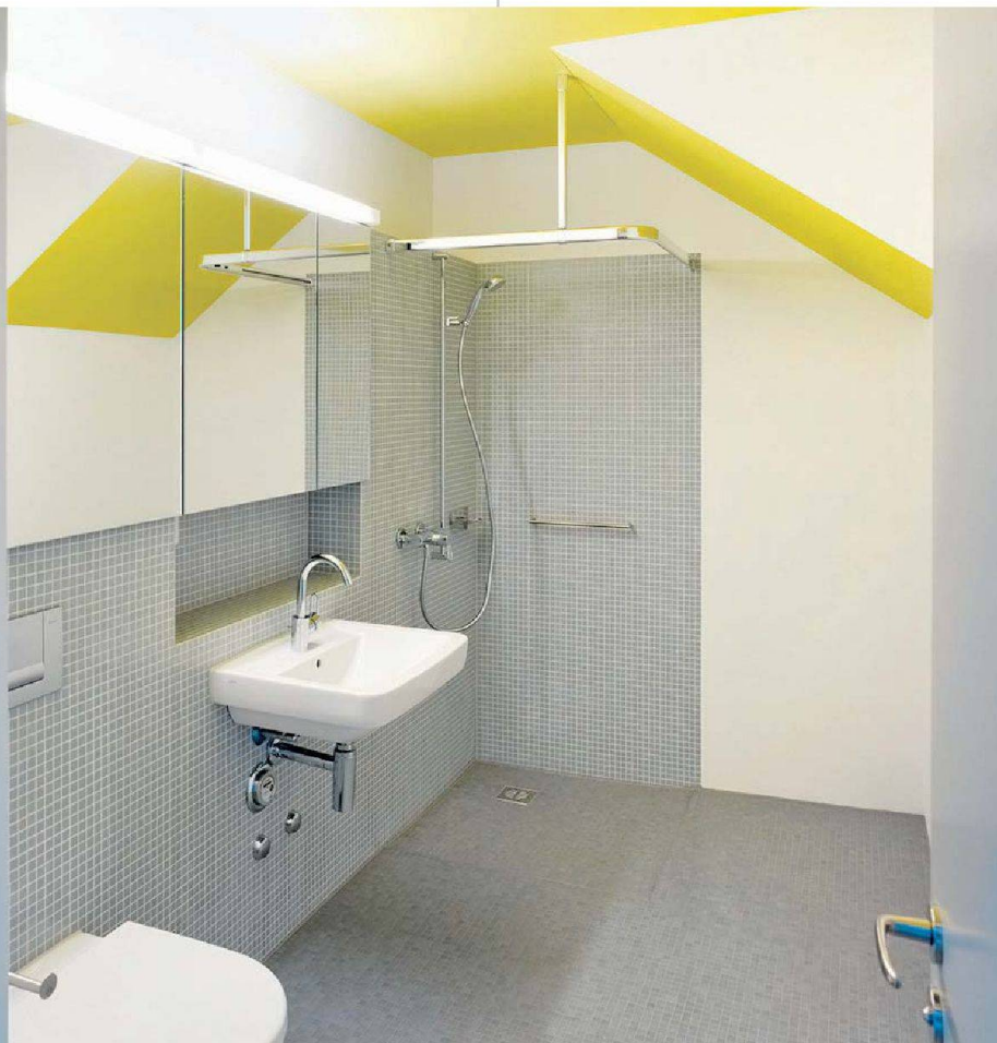
Die Bäder sind hindernisfrei eingerichtet.