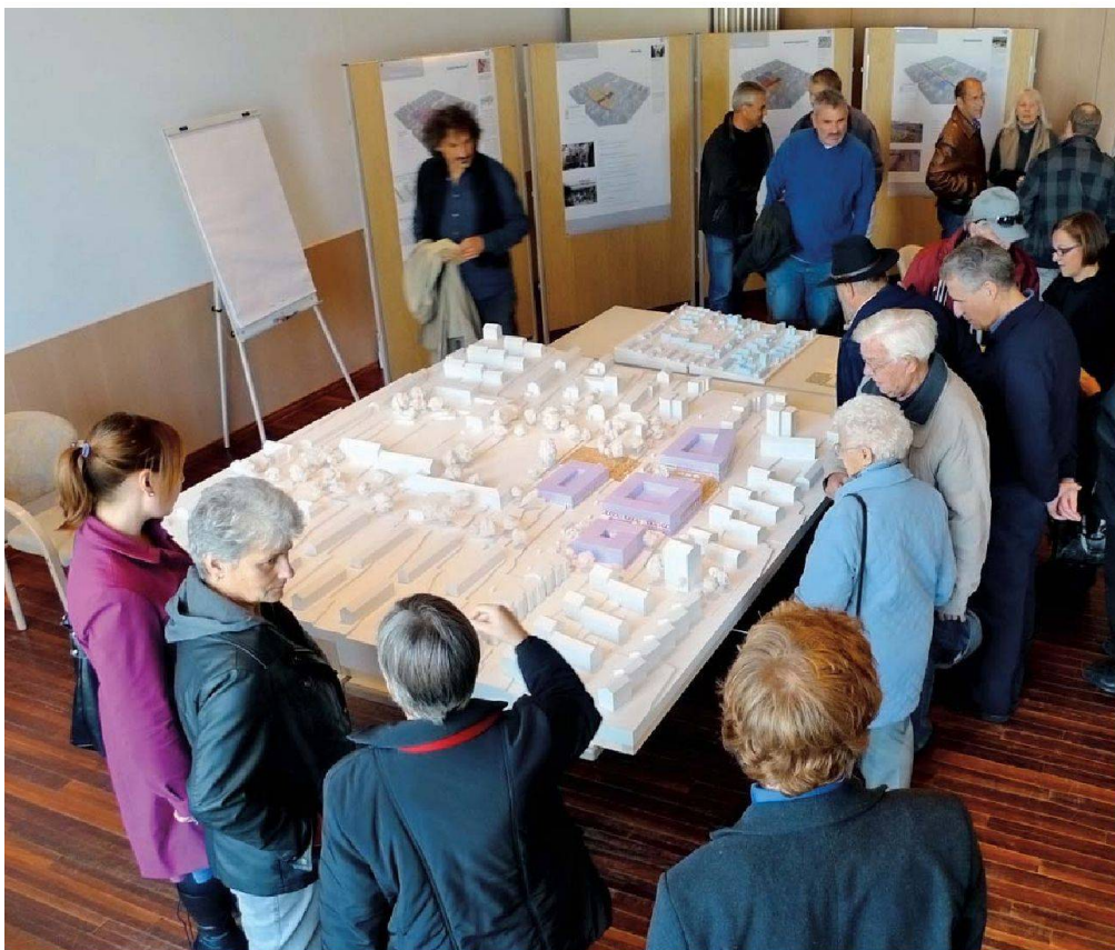
Die Zentrumsidee wurde mit einem Modell visualisiert, das an den Orientierungsversammlungen ausgestellt war.