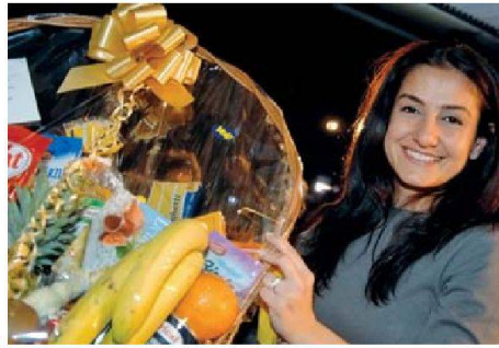
Eine tolle Verlosung und flotte Musik trugen zum gelungenen Fest bei.