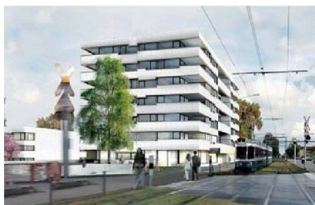
Enzmann + Fischer schlagen einen siebengeschossigen Baukörper an der Dübendorferstrasse und drei viergeschossige Bauten an der Altwiesenstrasse vor. In letzteren finden sich attraktive Maisonnettewohnungen für Familien.

Die Bau- und Wohngenossenschaft Graphis ersetzt ihre Wohnsiedlung zwischen Altwiesen- und Dübendorfstrasse in Zürich Schwamendingen. Die 1952 erstellten Bauten entsprechen in Bezug auf Wohnungsgrössen, Komfort und Energiebilanz nicht mehr den heutigen Anforderungen. Zudem ist das Grundstück heute stark unternutzt. Anstelle von 80 kleinen Altbauwohnungen können so in Zukunft mindestens 110 zeitgemässe Neubauwohnungen innerhalb der