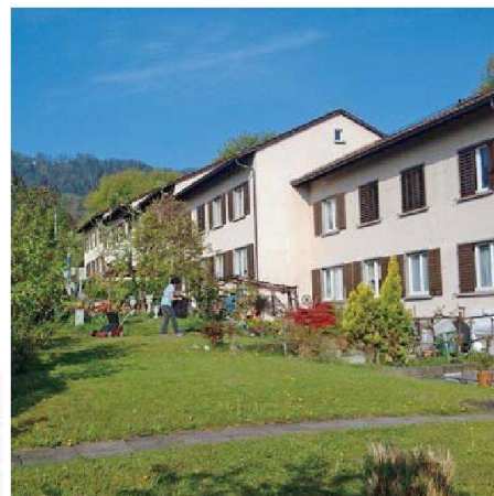
Die FGZ-Reihenhäuser an der Arbenalstrasse im Zürcher Friesenberg: energetische Prüfung vor der Sanierung.