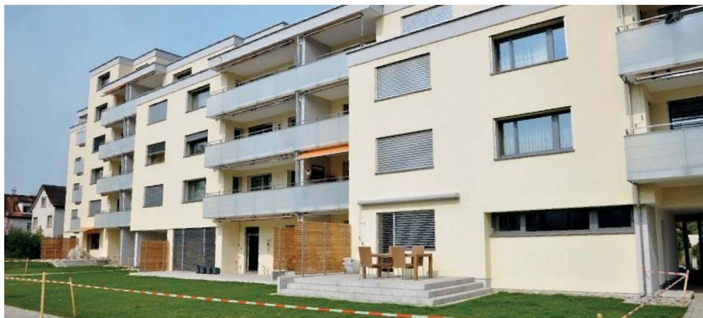
2009 sanierte die ASIG ihre Siedlungen Mattacker I und II in Zürich Seebach nach Minergie. Mit der Energieetikette wollte die Genossenschaft unter anderem überprüfen, ob die Energieziele erreicht worden waren.