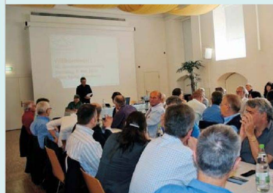
Der Regionalverband Bern-Solothurn feiert dieses Jahr sein 90-Jahr-Jubiläum.