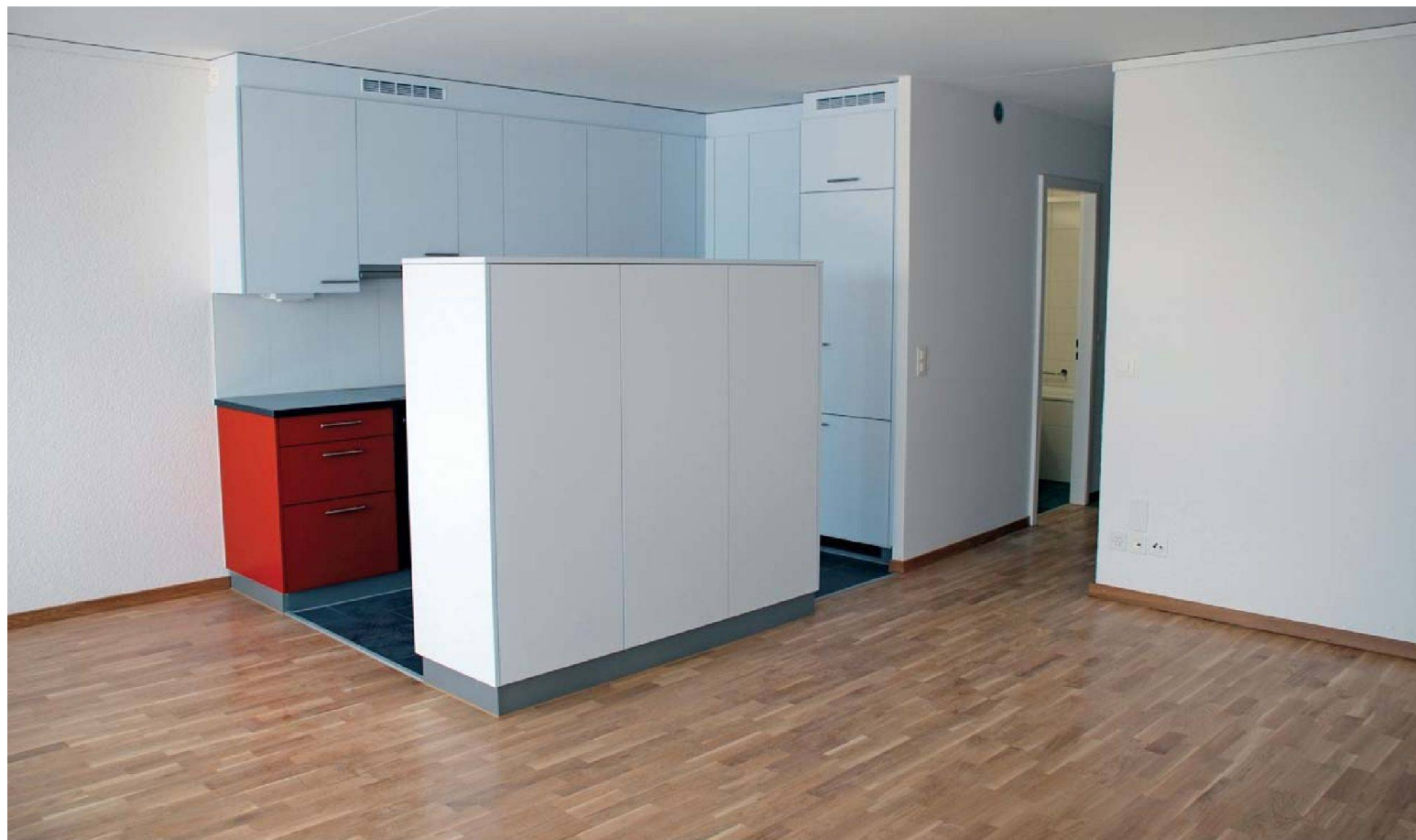
Mehr Grosszügigkeit in den Wohnungen: Die Küchen sind nur noch durch ein halbhohe Möbel vom Wohnzimmer abgetrennt. Zwischen Küche und Bad ist der neue Technikblock untergebracht.