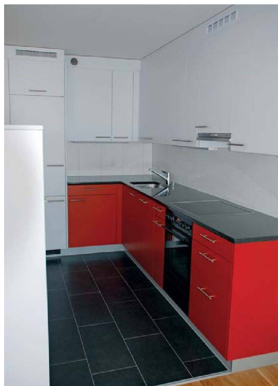
Blick in erneuerte Küche und Bad.