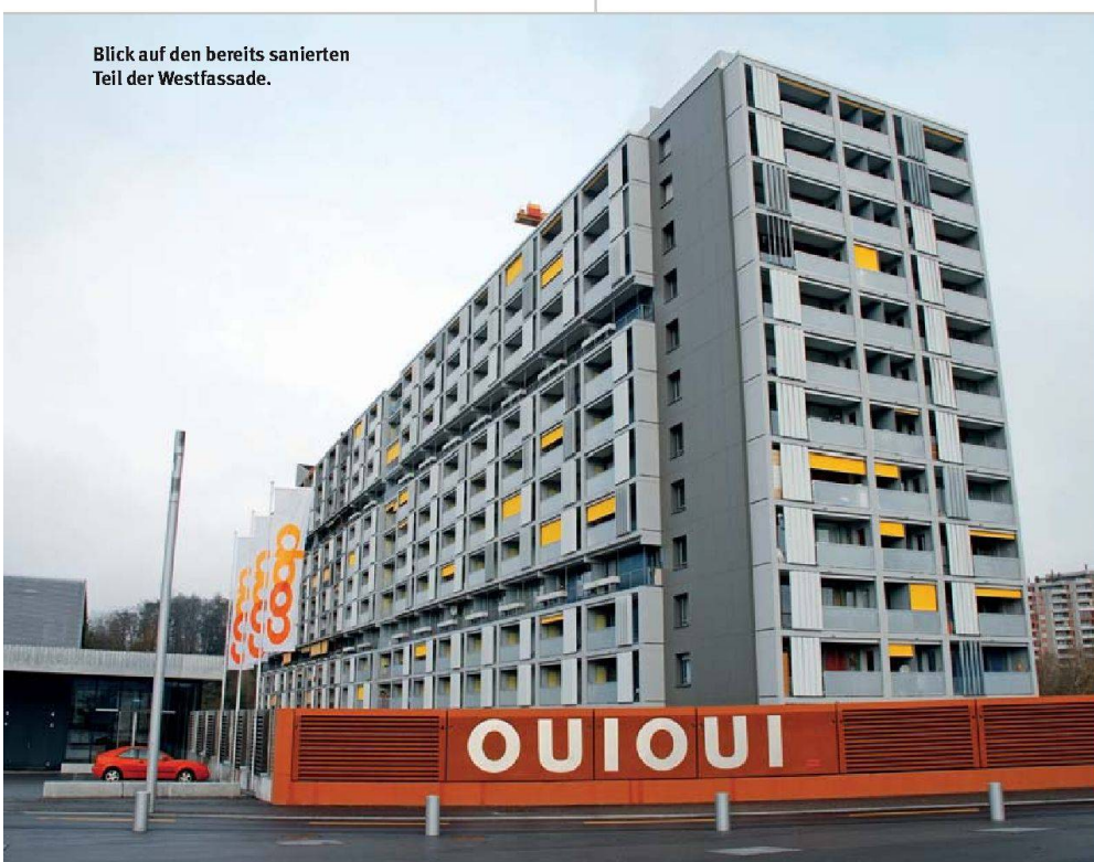
Blick auf den bereits sanierten Teil der Westfassade.

All dies gilt für die Überbauung Gäbelbach bis heute. Ein soeben erneuertes Ladenzentrum und ein Restaurant ergänzen das Wohnangebot. Zudem steht ein Quartierzentrum mit Hallenbad, Bibliothek, Kindergarten, Schulen und diversen Mehrzweckräumen zur Verfügung. Ein aktiver Quartierverein sorgt für ein reichhaltiges Freizeitangebot. Nach wie vor grenzen die Gäbelbach-Hochhäuser an Wiesen und Weiden. Daran ändert auch das heranwachsende Quartier Brünnen mit seinem berühmten Einkaufszentrum von Stararchitekt Daniel Libeskind nichts. Wohl aber trägt es zur Aufwertung der Gegend bei, die nicht nur über einen neuen Bahnhof verfügt, sondern bald eine eigene Tramlinie erhalten wird.