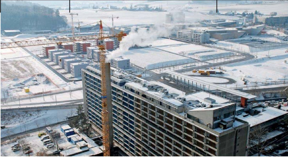
Block A wiederum mit bereits erneuerter linker Gebäudehälfte. Im Hintergrund das heranwachsende Quartier Brünnen mit Siedlungen der FAMBAU (rot), der Baugenossenschaft Brünnen-Eichholz (grau) sowie dem Einkaufszentrum Westside (rechts oben).