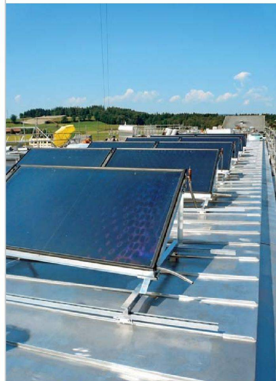
Die Solaranlage umfasst 120 Flachkollektoren.

Die vielfältigen Herausforderungen, die das Projekt stellte, können hier nur punktuell aufgeführt werden. Besonders zu schaffen machte den Verantwortlichen die Umsetzung der neuen Vorschriften im Brandschutzbereich, steht in den Treppenhäusern doch wenig Platz zur Verfügung. Die Baustelle war vom parallelen Ablauf der unterschiedlichen Arbeiten an der Fassade, am Dach und im Hausinnern gekennzeichnet. Während der ganzen Bauzeit mussten zwei unabhängige Leitungssysteme – alt und neu – betrieben werden, um stets alle Wohnungen zu versorgen. 1,2 Kilometer Kernbohrungen waren nötig, um alle Lei-