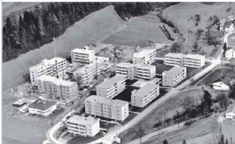
Blick auf das Weier-Quartier, wo Anfang der 1970er-Jahre die zweite Bauetappe läuft.

Im Mai 1961, nur 14 Monate nach der Genossenschaftsgründung, konnte man zum Spatenstich schreiten – noch im gleichen Jahr zogen die ersten Mieter ein. Schlag auf Schlag erstellte die Genossenschaft weitere Bauten, bis sie 1975 stolze 234 Wohnungen besass. Nun folgten harte Jahre, waren die Industriedörfer im Zürcher Oberland doch von der Rezession be-