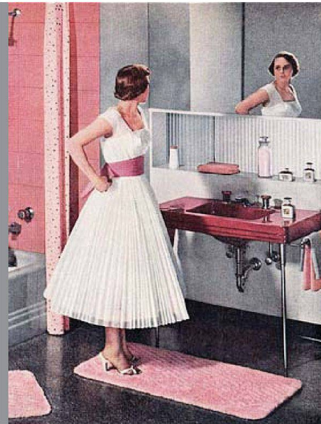
In den Fünfzigerjahren versuchte man die durch die serielle Fertigung entstandene Gleichförmigkeit mit bunten Plättli und Apparaten zu durchbrechen.

insbesondere in den Städten den Umgang mit Wasser. Hygiene wurde zum Garant nicht nur für körperliche Gesundheit, sondern auch für moralische Integrität. Einer reinlichen Person mit sauberen Kleidern attestiert man bis heute Anstand und Rechtschaffenheit. Oberstes Ziel der städtischen Behörden und Grund für die aufwändigen infrastrukturellen Arbeiten, im Zuge derer schliesslich auch die ersten Wohnhäuser mit Druckleitungen ausgerüstet wurden, war denn auch die Schaffung hygienischer Wohnverhältnisse. Wasser floss nun plötzlich schier unbegrenzt. Die parallel entstehenden Gas-Durchlauferhitzer und Zentralheizungen wärmten nicht nur das Wasser und die Räumlichkeiten, sondern auch bereitliegende Handtücher oder Bademäntel.