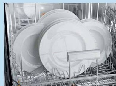
Teller bis Ø 35 cm