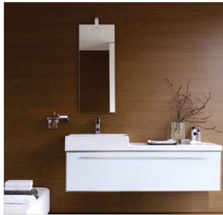
Schlicht und ruhig: Laufen (living city)