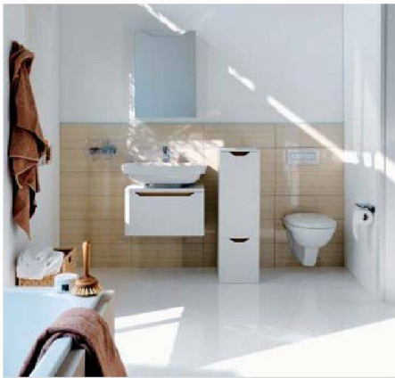
Entspannte Badgestaltung: Laufen (moderna plus)