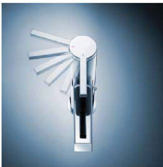
Spart warmes Wasser: Ava Coolfix (Arwa)

sehr flexibel kombinierbar sind auch die Badmöbel des Programms «Twist» von 4B Badmöbel, das gemäss Herstellerin bis zu tausend verschiedene Möglichkeiten erlaubt. Richner bietet mit «Uno» ein preisgünstiges Komplettbad, das speziell für Mietwohnungen konzipiert wurde.