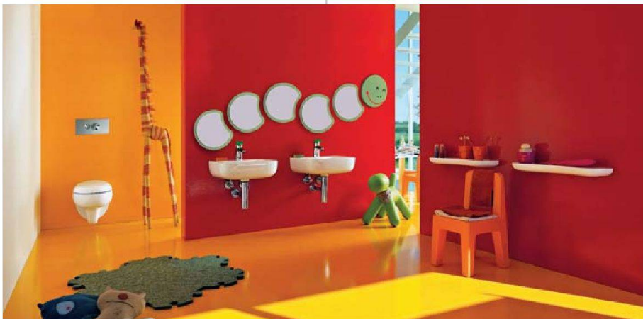
Kinderbad mit Blümchen und Raupen: Keramik Laufen

versteuen lassen, und mit einheitlichen Produktlinien. Beispiele sind die bereits erwähnte Serie «moderna plus», die sich auch mit Naturmaterialien kombinieren lässt, oder «living city» mit geometrisch geformten, schlichten Möbeln. Auf Naturoptik und ökologische Materialien setzt auch Richner mit dem Programm «Atlas Concorde».