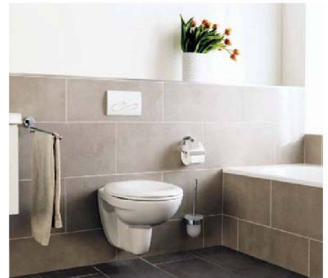
Speziell für Mietwohnungen: Richner