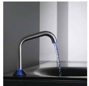
Buntes Wasser von Zauberhand: KWC