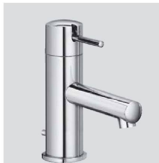
Schlicht und sparsam: Similar