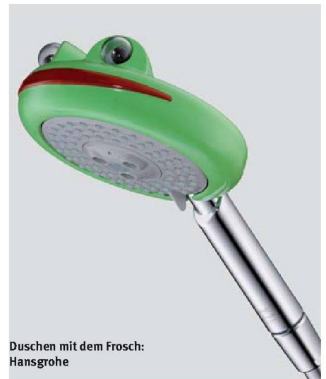
Duschen mit dem Frosch: Hansgrohe