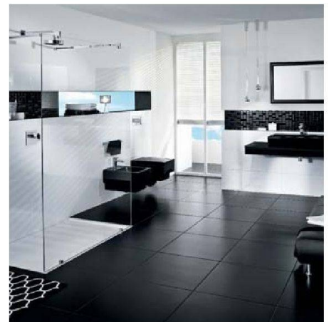
Ungewohnt: schwarze Keramik von Villeroy & Boch