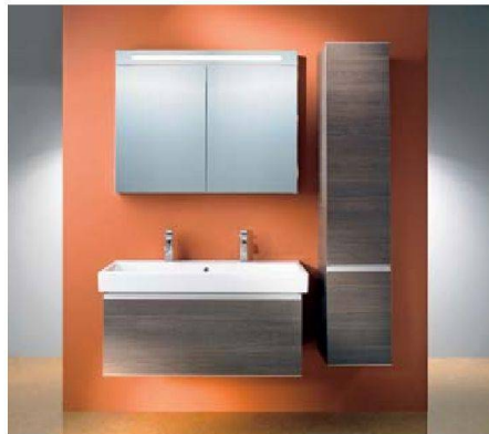
Über 1000 Kombinationsmöglichkeiten: 4B