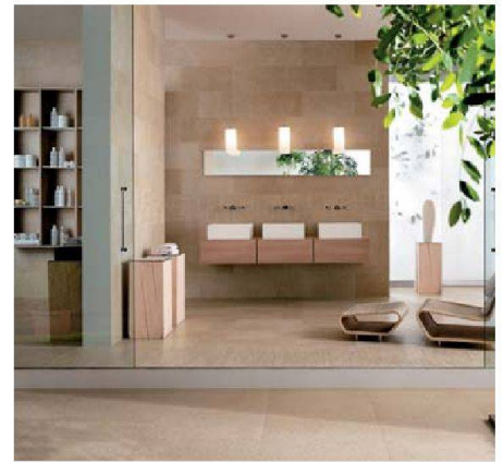
Ökologische Materialien: Richner