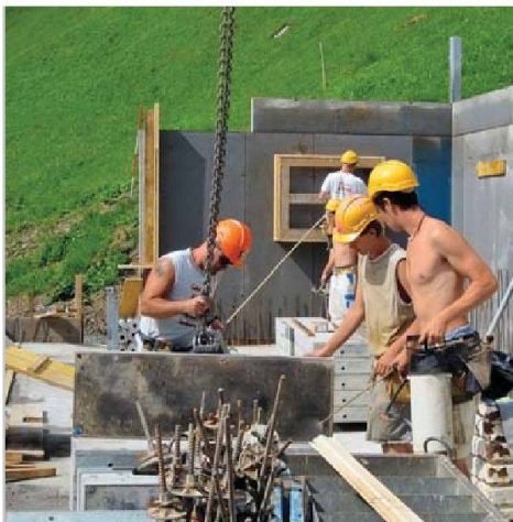
Anpacken für einen guten Zweck: Lernende der Robert Spleiss AG und der Jäggi + Hafter AG erstellen für eine Bergbauernfamilie einen neuen Stall.

Drei ganz besondere Projektwochen gab es diesen Sommer für 19 Lernende der Bauunternehmungen Robert Spleiss AG und Jäggi + Hafter AG. Sie halfen nämlich bei der Erneuerung eines Bergbauernhofs im Urner Schächental tatkräftig mit. Ihre Aufgabe war der Neubau eines Rindviehlaufstalles, der heutigen Tierschutzbestimmungen entspricht. Das Projekt wurde von der Koordinationsstelle für Arbeiten im Berggebiet (KAB) organisiert. Die Lernenden führten die Ortbetonarbeiten, wie Bodenplatten, Brüstungen und Wände schalen, bewehren und betonieren, aus. Jeweils ein Polier der beteiligten Firmen begleitete die Gruppe und unterstützte sie fachlich. Zweck dieses wohlthätigen Projekts war einerseits die Erweiterung des Fachwissens, aber auch die Förderung der Sozialkompetenz.