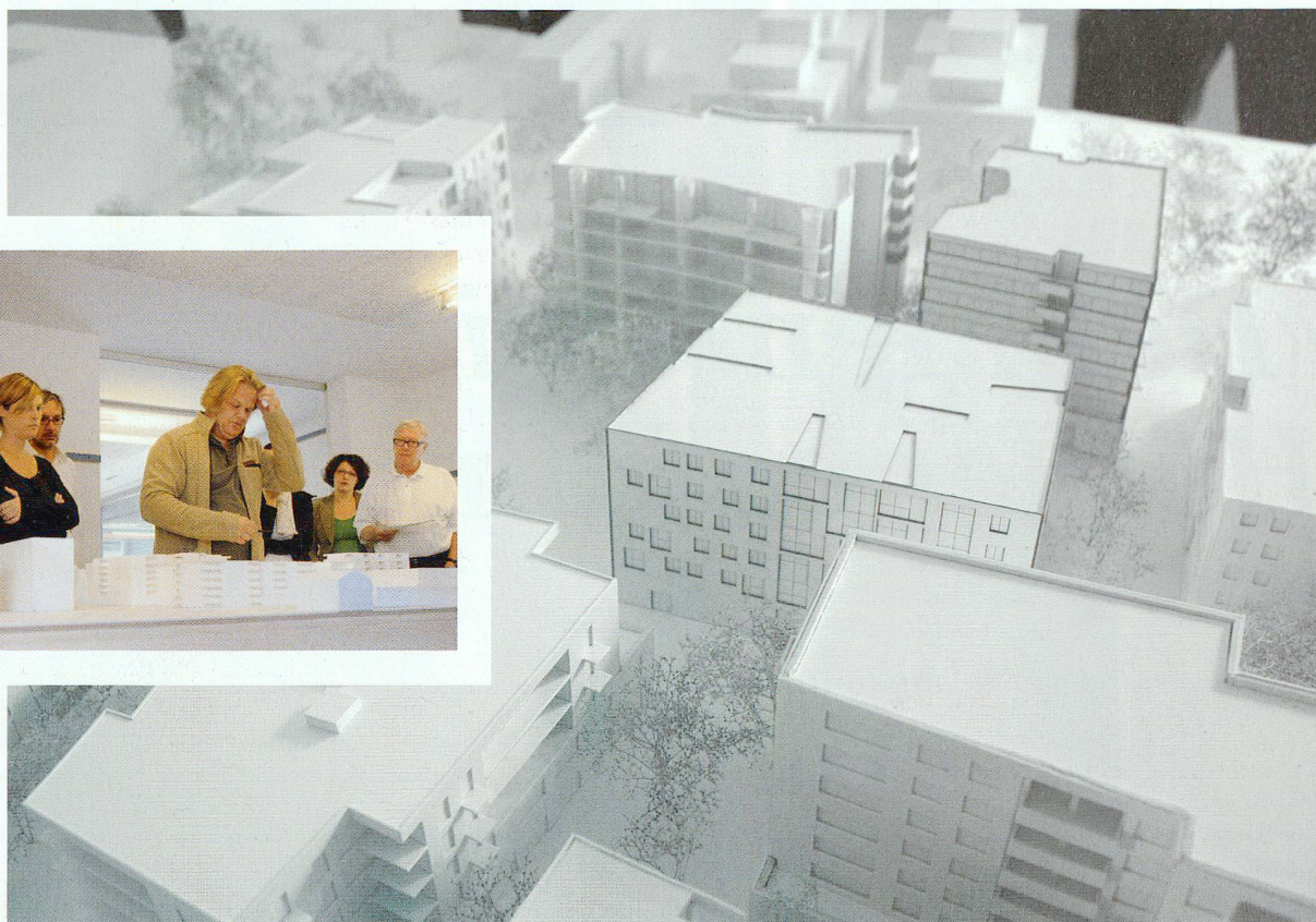
Modellbild: Nikolas Lill, pool Architekten