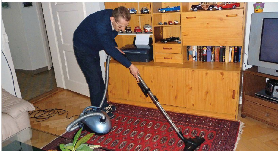
Bei Bedarf unterstützt Casanostra seine Mieterinnen und Mieter auch dabei, im Alltag wieder Fuss zu fassen.