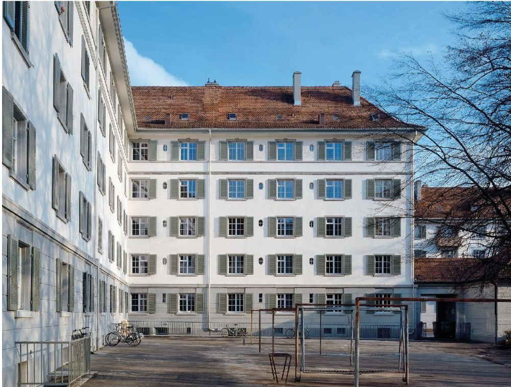
Gelungener Umgang mit dem Erbe der Baukultur: die städtische Wohnsiedlung Zurlinden in Zürich von 1918 nach der 2007 abgeschlossenen Gesamtinstandsetzung.

angebracht, aber ansonsten sind die Häuser aussen praktisch noch im Originalzustand erhalten.