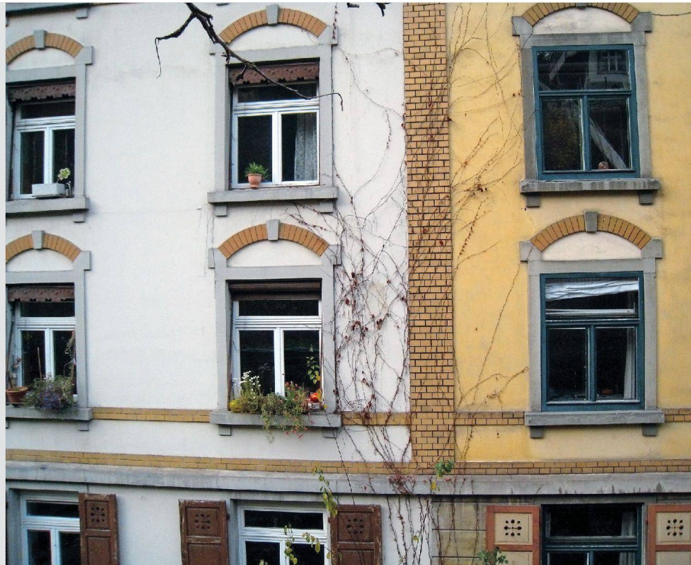
Hohe Qualität: Die Fassaden des Hauses rechts mussten in hundert Jahren nie renoviert werden. Das weiss gestrichene Nachbarhaus wurde dagegen in den 1980er-Jahren nicht sachgemäss renoviert – prompt zeigen sich Putz- und Farbschäden (vgl. Detailbild links aussen).