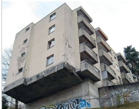
Jüngere Bauten weisen oft eine viel schlechtere Qualität auf. So dieses Mehrfamilienhaus aus den 1970er-Jahren in St. Gallen, das grossen Sanierungsbedarf aufweist.

Siedlungen der Baujahre 1911 bis 1924 im Sihlfeld erinnern mit ihrer Fassadengestaltung, mit den gekonnt gestalteten Giebeln und Mansarden an den frühen Heimatstil. Aussen haben die Gebäude einen neuen Anstrich bekommen, in diesem Jahr werden die Estrichböden isoliert und neue Fenster