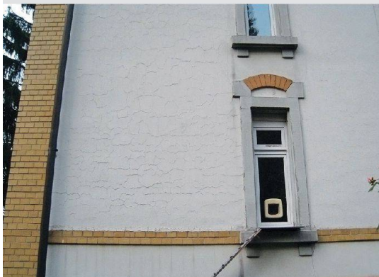
Ganz oben: Haus vom gleichen Bautyp wie die Gebäude auf dem Bild rechts: Im Zuge der Fassadenerneuerung hat es jeglichen Schmuck verloren. Darunter: Fassadenschäden nach unsachgemässer Renovation.