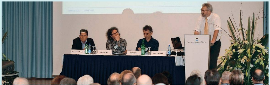
Geschäftsführer und Vorstand informierten über die Aktivitäten des SVW Zürich.