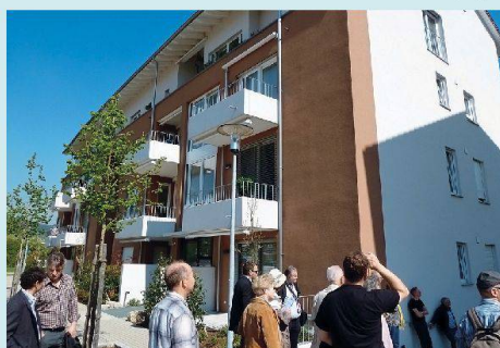
Besichtigungstermin bei den Eigentumswohnungen der Familienheimgenossenschaft an der Rein-Au in Bad Säckingen.