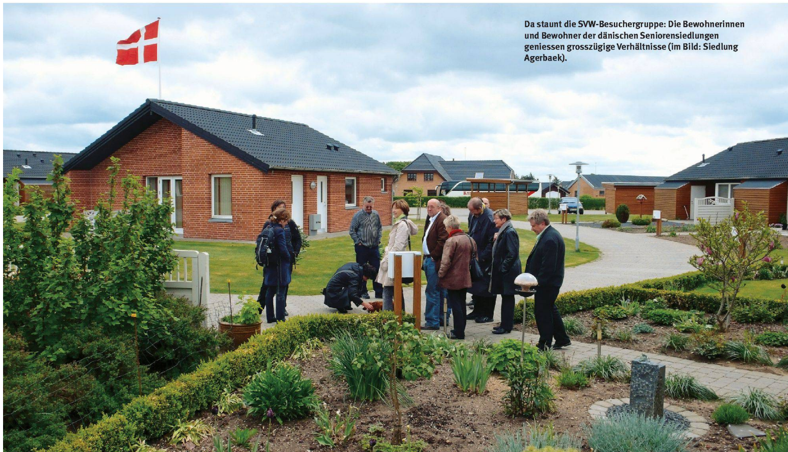
Da staunt die SVW-Besuchergruppe: Die Bewohnerinnen und Bewohner der dänischen Seniorensiedlungen geniessen grosszügige Verhältnisse (im Bild: Siedlung Agerbaek).

Gemeinschaftliches Wohnen ist unter dänischen Seniorinnen und Senioren beliebt. Und auch in den Pflegeeinrichtungen wird grosser Wert auf eine hohe Lebensqualität gelegt. Bericht einer spannenden und anregenden SVW-Studienreise nach Skandinavien.