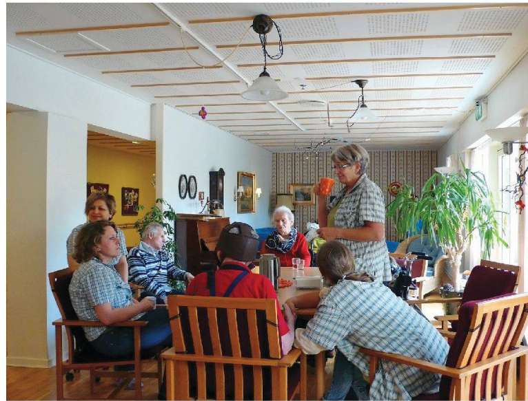
Wohnlich eingerichtete Gemeinschaftsräume und eigene Wohnungen gibt es auch in Demenz-Wohngruppen (hier die Pflegeeinrichtung Lindegården).

liche Hilfe gelingt, war gegen Ende der Reisewoche zu besichtigen: In der Nähe von Kopenhagen liegt die private Seniorenwohnanlage «Egebakken», deren Bewohner ebenfalls mit «50 plus» definiert sind. Ihre Reihenhaussiedlung wurde als Wohneigentum räumlich grosszügiger und architektonisch aufwändiger realisiert.