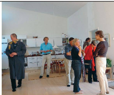
Zeit für persönliche Gespräche: Die Reisegruppe bei der Besichtigung eines Reihenhauses in der Seniorenwohnanlage Egebakken.