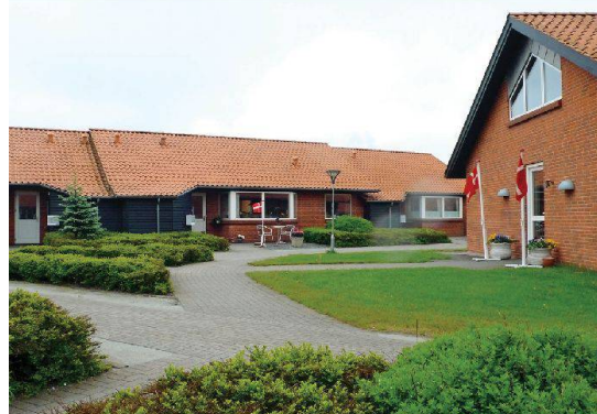
Seniorenwohngemeinschaft Nyboder: 15 Reiheneinfamilienhäuser bilden einen Ring um den gemeinsamen Hof mit dem Gemeinschaftshaus.

cke waren äusserst informativ, die Gastfreundschaft beeindruckend und trotz etlicher Sprachbarrieren war es den Besuchern aus der Schweiz jeweils möglich, sich direkt mit den Bewohnern zu unterhalten. Gewöhnungsbedürftig blieb einzig der zwar reichlich ausgeschenkte, aber durchwegs nur aufgebrühte Kaffee.