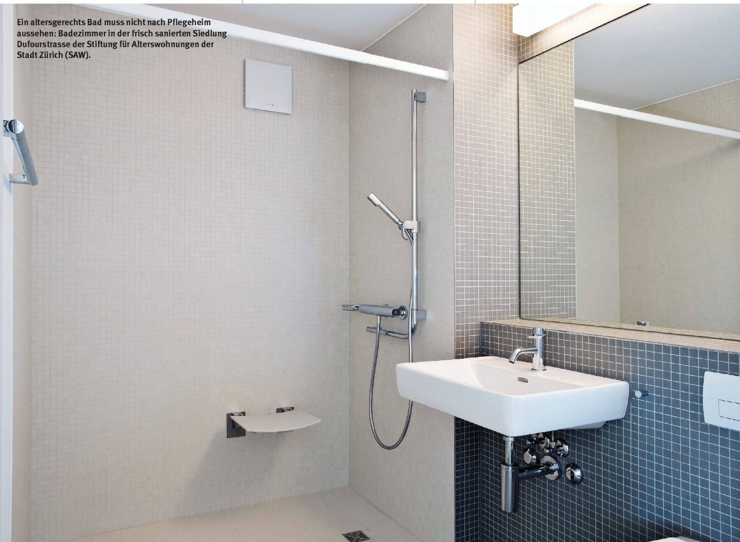
Ein altersgerechtes Bad muss nicht nach Pflegeheim aussehen: Badezimmer in der frisch sanierten Siedlung Dufourstrasse der Stiftung für Alterswohnungen der Stadt Zürich (SAW).