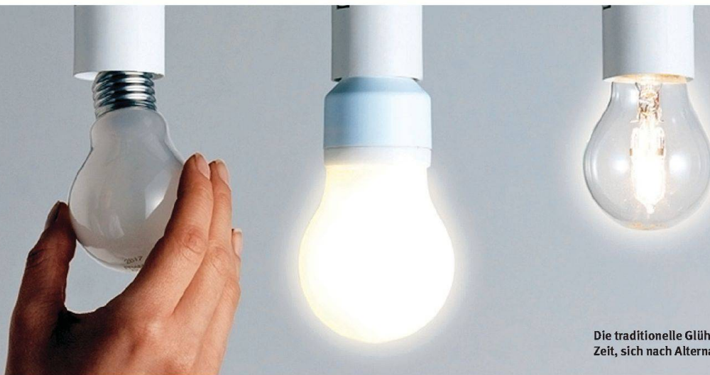
Die traditionelle Glühlampe hat bald ausgedient. Zeit, sich nach Alternativen umzusehen.

Stromsparlampen, Eco-Halogenlampen und LED-Leuchten bieten sich als ökologischere Alternativen an und ermöglichen ganz neue Lichteffekte. Was es dabei zu beachten gilt.