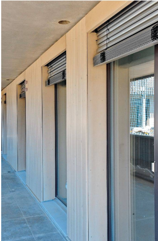
Der Baustoff Holz bestimmt auch das optische Bild.

2000-Watt-Gesellschaft lässt sich ablesen, dass dazu jede passende Gelegenheit genutzt werden soll: Der Energieverbrauch pro Kopf ist um den Faktor drei – von aktuell 6500 Watt auf 2000 Watt – zu senken und der Treibhausgasausstoss von heute neun auf eine Tonne zu reduzieren.