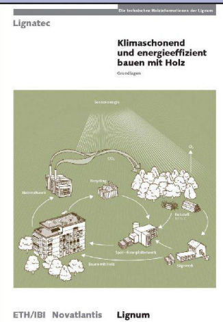
ETH/IBI Novatlantis Lignum

aus Erstellung, Betrieb und Rückbau in Korrelation mit erneuerbaren und nichterneuerbaren Heizenergieträgern. Die zweite Publikation zur Umsetzung klimaschonender und energieeffizienter Holzbauten wird im Winter 2011, die dritte zum Thema Gebäudezertifizierung im Sommer 2012 erscheinen. Die aufwendige Forschungsarbeit, die hinter dieser Arbeit steckt, wurde von verschiedenen Organisationen, darunter der SVW, unterstützt. Bestellung: www.lignum.ch