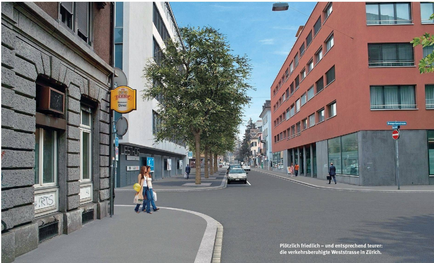
Plötzlich friedlich – und entsprechend teuer: die verkehrsberuhigte Weststrasse in Zürich.

Jeder sechste Schweizer leidet unter Verkehrslärm. Das vermindert nicht nur die Wohnqualität der Betroffenen, sondern auch den Wert der Liegenschaften. Oder anders: Wer ruhig wohnen will, bezahlt mehr Miete als an einer lärmigen Lage. Wie sich Lärm und andere Lagefaktoren auf den Mietzins auswirken, rechnet eine Studie der ZKB vor.