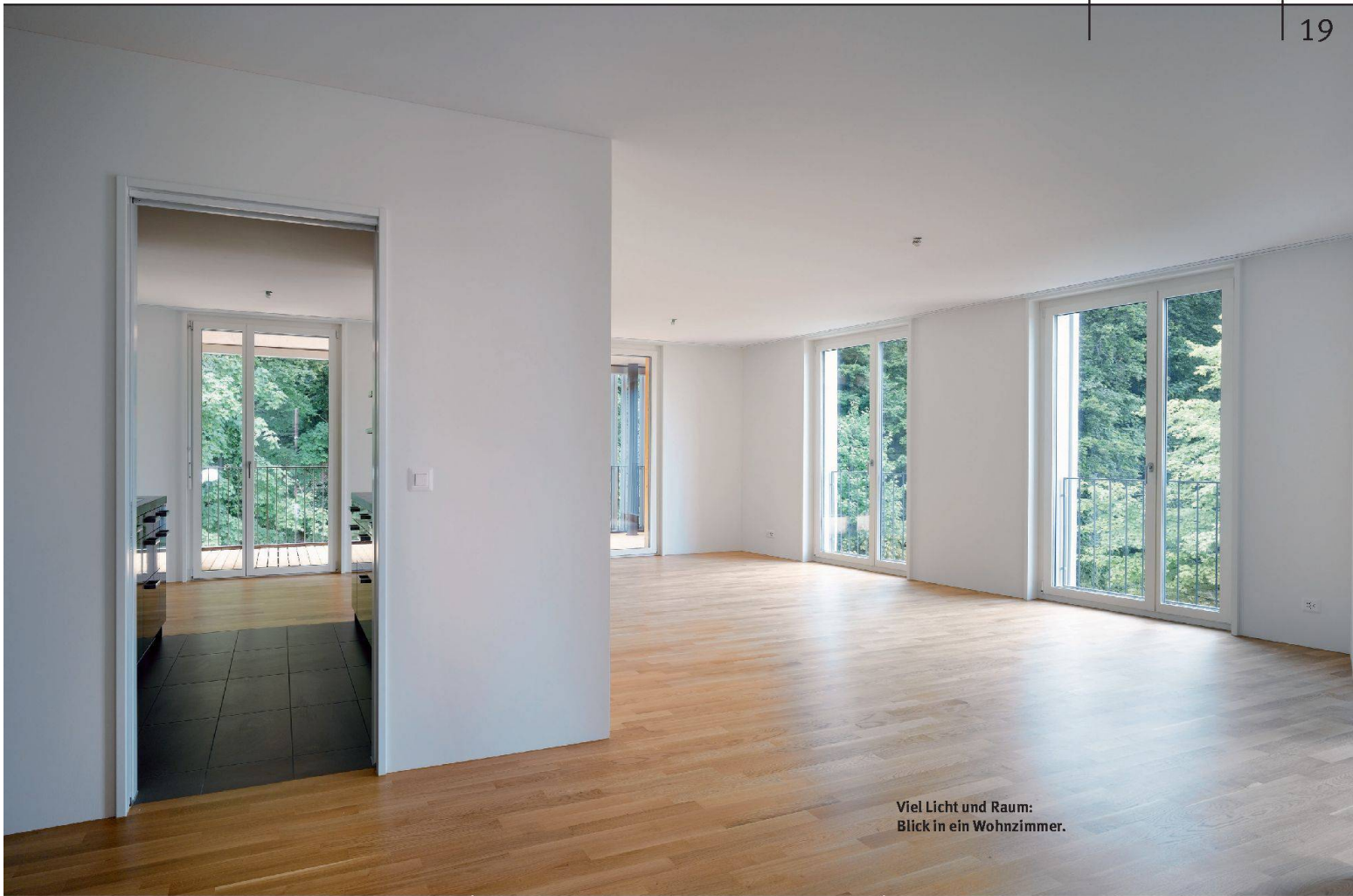
Viel Licht und Raum: Blick in ein Wohnzimmer.

kleiden die Fassaden. Verschiebbare Alu-Lamellenelemente vor den Fenstern bilden dazu einen Kontrast. Sie dienen als Sicht- und Sonnenschutz, sorgen aber auch für ein ständig wechselndes Fassadenbild – und blitzen wunderbar in der Sonne. Die Loggien sind mit Lärchenholz ausgekleidet, was ihnen viel Gemütlichkeit und Intimität verleiht. Kein Wunder, dass mancher Bewohner den privaten Aussenraum gar mit Bildern schmückt.