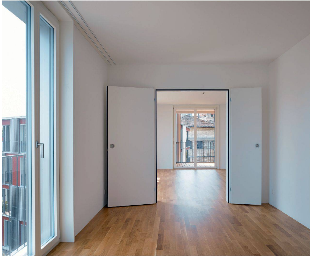
Dank einer Flügeltür kann das Wohnzimmer individuell vergrössert werden.

Auch das neuste Projekt im Kreis 4 stammt von diesem Büro (vgl. Kasten).