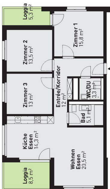
Grundriss einer 4 1/2-Zimmer-Wohnung.

vor einiger Zeit ein Konzept entwickeln lassen. Dieses verlangt unter anderem, dass bei Sanierungen und Neubauten der Artenvielfalt besondere Beachtung zukommt (siehe wohnen 07-08/2010). Der Limmat-