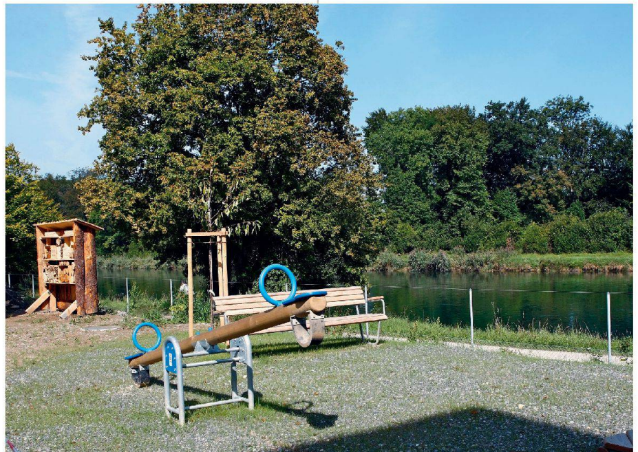
Ein Aspekt des Aussenraumkonzepts der SGE, das auf Artenvielfalt setzt: das Bienenhotel (links).