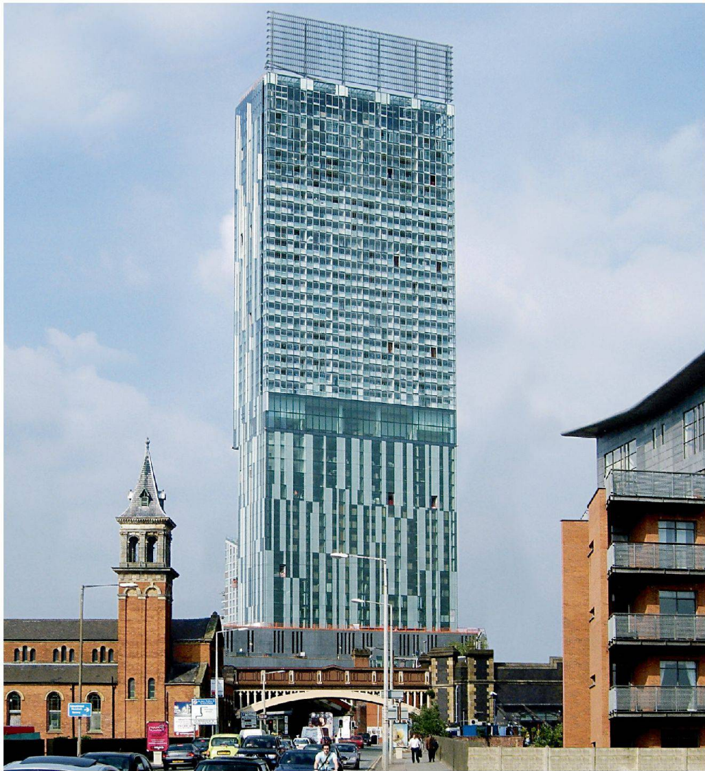
Beetham Tower, Manchester