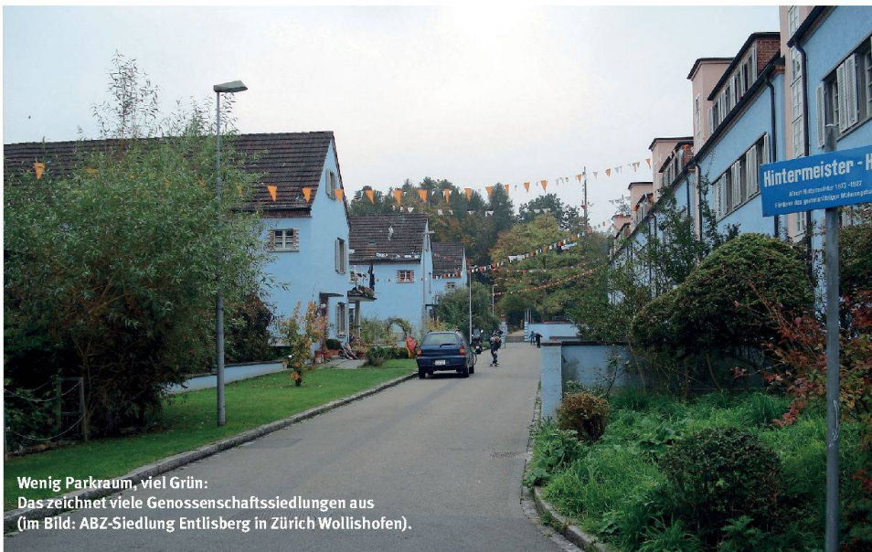
Wenig Parkraum, viel Grün: Das zeichnet viele Genossenschaftssiedlungen aus (im Bild: ABZ-Siedlung Entlisberg in Zürich Wollishofen).

Resultat: Stattliche 55 Prozent der untersuchten Genossenschaftshaushalte leben ohne eigenen Wagen. An der Röntgenstrasse im urbanen Kreis 5 hat gar nur jeder vierte Haushalt ein Auto. Gegen den Stadtrand hin steigt die Zahl der Autobesitzer dagegen wieder. Mit 0,24 Autos pro Person ist der Motorisierungsgrad der Genossenschaftler trotzdem deutlich tiefer als der städtische Durchschnitt von 0,36. Damit ist gemäss Studie der Beweis erbracht, dass die 2000-Watt-Gesellschaft im Mobilitätsbereich bereits gelebt wird und ihre Ziele nicht unerreichbar sind.