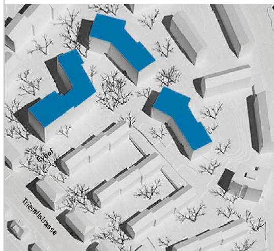
Siegerprojekt von Adrian Streich Architekten für den Ersatz der Siedlung Eyhof. Die erste Etappe (dunkelblau) umfasst drei geknickte Bauten, die einen gemeinschaftlichen Freiraum bilden.

Erwähnenswert ist, dass fast alle Wohnungen mit einfachen Massnahmen mit einem zusätzlichen Zimmer versehen werden können. Eine 3½-Zimmer-Wohnung kann so in eine preiswerte 4-Zimmer-Woh-