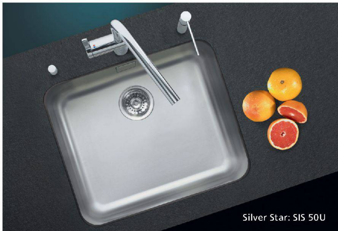
Silver Star: SIS 50U