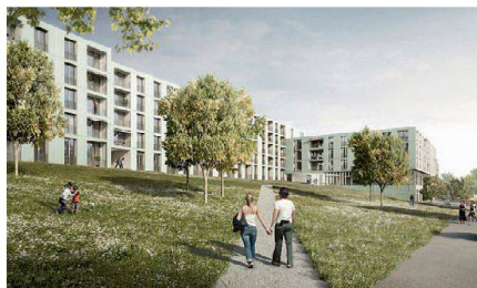
Beim neuen Quartierzentrum am Friesenberg entstehen zwei attraktive Plätze.