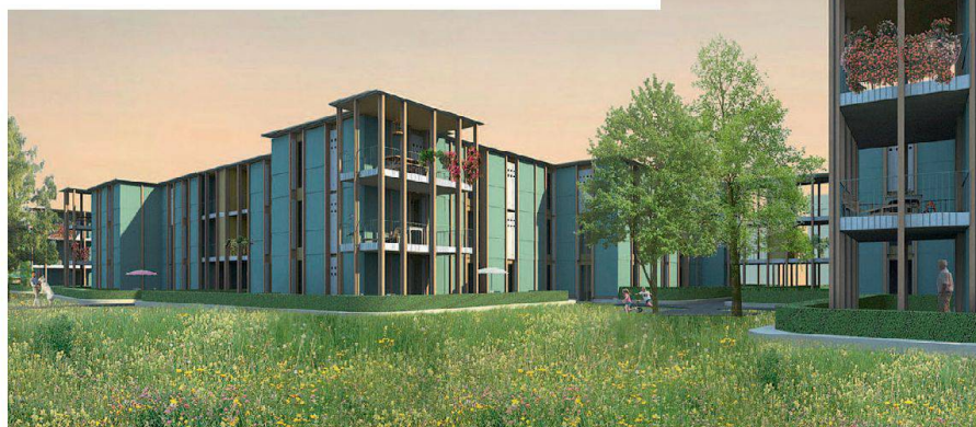
Neue Interpretation der Gartenstadt: Siegerprojekt von Knapkiewicz & Fickert für die Teilareale A und B der Siedlung Schönauring, Baugenossenschaft Schönau.