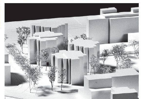
Aufs Alter zugeschnitten: Neubauprojekt von Abraha Achermann Architekten an der Helen-Keller-Strasse in Zürich Schwamendingen.

Siegerteam hat sich gemäss Jury sensibel mit dem Thema Gartenstadt Schwamendingen auseinandergesetzt. Die Gestaltung des Grünraumes, der die vier Wohnblöcke grosszügig umgibt, bietet hohe Qualitäten für ältere Menschen. Vom grössten Teil der Wohnungen ist ein mehrseitiger Ausblick auf den attraktiv gestalteten Grünraum möglich.