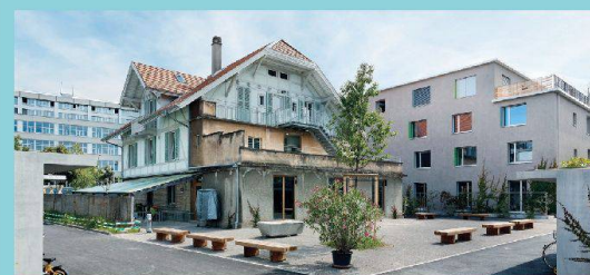
1. Rang in der Kategorie «Ökologie und Energie»: Siedlung Burgunder.