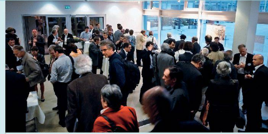
Der SVW Zürich war dieses Jahr in Horgen zu Gast.