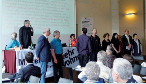
Der Regionalverband Bern-Solothurn nominierte sechs aussergewöhnliche Projekte für den Schweizer Genossenschaftspreis.