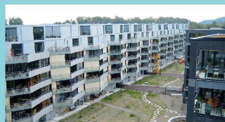
1. Rang in der Kategorie «Architektur und Städtebau»: Siedlung Hardegg der BG Brünnen-Eichholz.