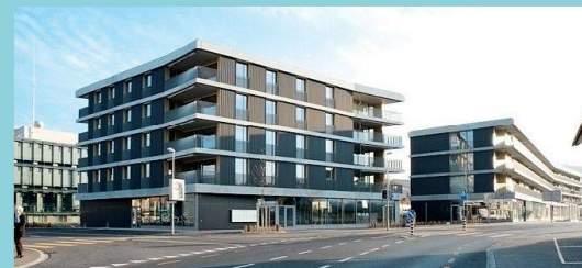
2. Rang in der Kategorie «Genossenschaftliches Wohnen»: Betriebsgenossenschaft «Am Hof», Köniz.