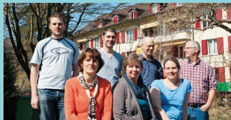
1. Rang in der Kategorie «Genossenschaftliches Wohnen»: Genossenschaft Rossfeld, Bern.

Mehr zu den einzelnen Projekten und den detaillierten Jurybericht finden Interessierte unter www.svw-beso.ch