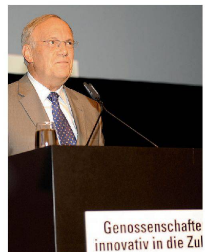
Wettbewerb gilt für alle: Bundesrat Johann Schneider-Ammann

stützt. Und dies gelte auch weiterhin, brauche es doch auch in attraktiven Regionen ein preisgünstiges Wohnungsangebot für alle. Der Bundesrat habe deshalb das Bundesamt für Wohnungswesen (BWO) damit beauftragt, bis Ende Jahr zu prüfen, wie der Bund den gemeinnützigen Bauträgern den Zugang zu Bauland erleichtern könne.