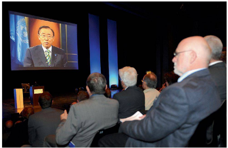
«Cooperatives truly do build a better world», sagte Uno-Generalsekretär Ban Ki-Moon in der per Film eingespielten Grussbotschaft.