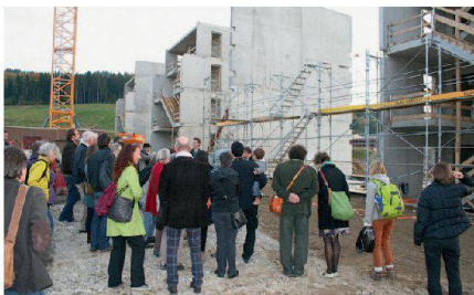
Im Oberfeld in Ostermundigen entsteht eine autofreie Siedlung mit hundert Wohnungen.

Dort entstehen nun drei ökologisch hochstehende Mehrfamilienhäuser, werden sie doch in Holzbauweise und im Standard Minergie-P errichtet. Zwar brauchen nur zehn Parkplätze erstellt zu werden, doch muss die Genossenschaft Vorkehrungen treffen, um nötigenfalls weitere Plätze zur Verfügung zu stellen. So ist etwa der Platz für eine Einstellhalle freizulassen. Um die Finanzierung zu erleichtern, vergibt man vierzig Prozent der Wohnungen im Eigentum. Allerdings wird auch dort der Genossenschafts-gedanke grossgeschrieben – dafür sorgen gemeinschaftliche Einrichtungen und Aussenräume, die in einem partizipativen Prozess gestaltet werden. Wohnen wird dieses Ausnahmeprojekt nach Fertigstellung ausführlich vorstellen. (rl)