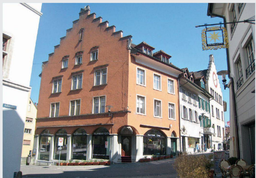
Erhaltenswert: die schicke Altstadt von Brugg

sogenannte Modellprojekte stellt. Diese unterstützt das Amt mit einem A-fondsperdu-Beitrag zusätzlich. Unabhängig von dieser Entscheidung hat der Stiftungsrat der Stiftung Solidaritätsfonds der Genossenschaft Altstadt Brugg für die anfallenden Erwerbs- und Renovationskosten ein rückzahlbares Darlehen in Höhe von 90 000 Franken gewährt.