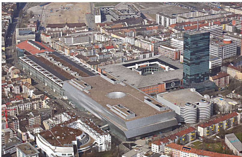
So präsentiert sich das Basler Messgelände nach dem Hallen-neubau.

ben viele Kernfragen die gleichen: Wie setzt man ein Gebäude oder einen Raum in Beziehung zu den Menschen? Insofern entfaltet gute Architektur eine grosse Wirkung und stellt ebenfalls eine Form der Energie dar. Es ist uns ein grosses Anliegen, an Podien wie an der Swissbau auf diesen Punkt aufmerksam zu machen: Das Metier des Architekten und Architektur an sich haben eine Kraft und eine Wirkung, die von sehr grosser Bedeutung ist.