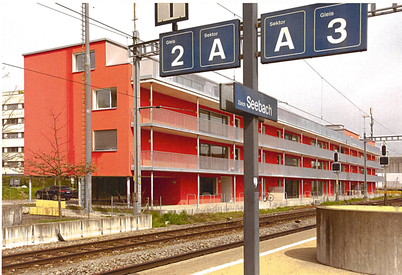
Den kecken Flachbau mit 103 Zimmern beim Bahnhof Seebach hat die WOKO in Rohbaumiete übernommen.