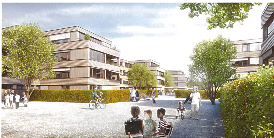
Der siegreiche Entwurf von Althammer Hochuli für die Neubausiedlung der BGZ in Rümlang.