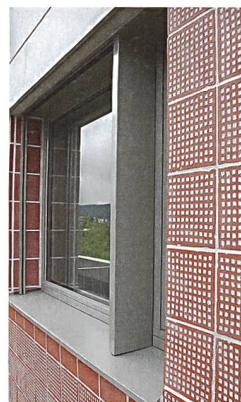
Die Klinkerfassade ist eine Neuentwicklung.

bengänge erschlossen und erhalten dank grosser Fenster viel Licht. Sie bieten allen gängigen Komfort. Mit Nettomieten von 1730 bis 1770 Franken für die 4½-Zimmer-Variante sind sie für Neubauten günstig. Bei Fertigstellung war die Hälfte der Wohnungen vergeben. Für die weitere Vermietung ist die Genossenschaft zuversichtlich, können sich die Interessenten doch nun am fertigen Objekt von der Qualität überzeugen.