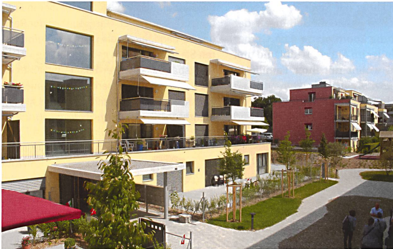
Siedlung Soligänter der Baugenossenschaft Gstückt in Bülach: Im Parterre links ist die Pflegewohnung eingerichtet. Ihr grosszügiger Aussenraum ist wegen der Demenzkranken eingezäunt.