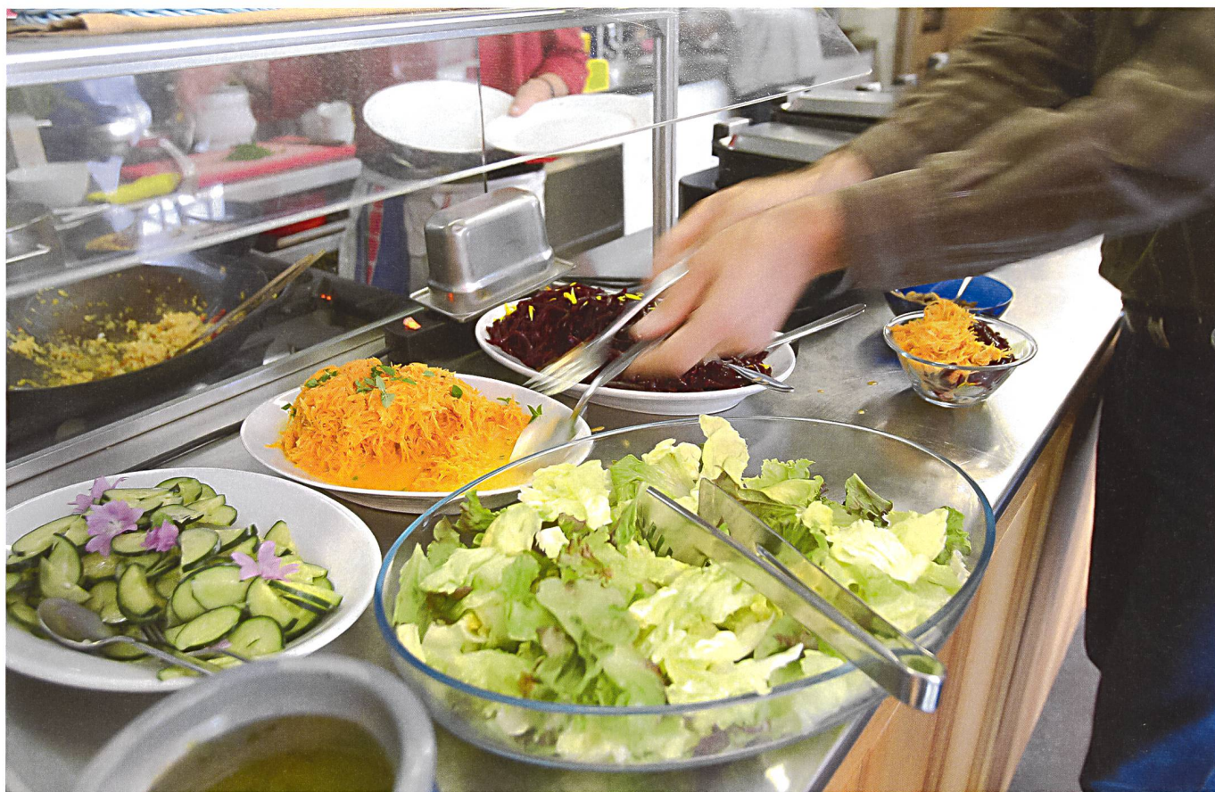
Einwandfreies Gemüse und Salate, die andernorts im Abfall gelandet wären.