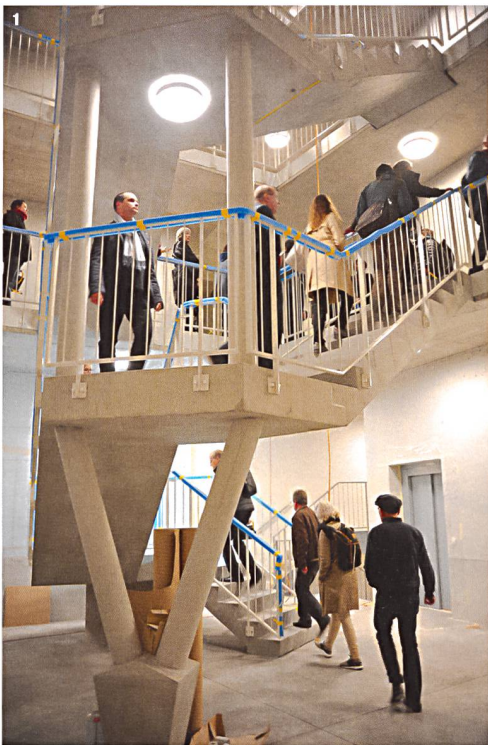
1 Spektakuläre Architektur bis ins Treppenhaus: Hunziker-Areal.