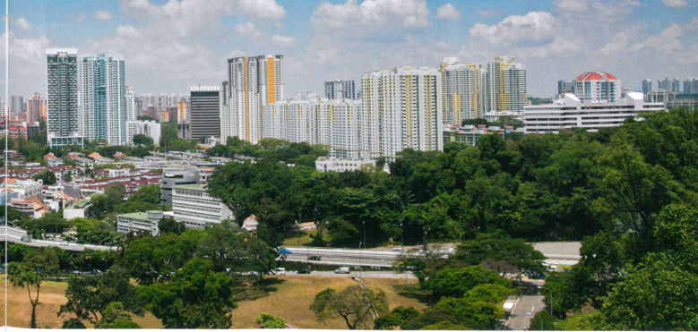
In Singapur wachsen viele – meist staatliche – Hochhäuser in den Himmel. Sie haben fast alle anderen Wohngebäude verdrängt.

Es existieren zwei Singapur. Das sichtbare ist überzogen von einer futuristisch anmutenden Hochhauslandschaft; das andere, unsichtbare lebt in den Erinnerungen der Bewohner. Beide Singapur existieren und beeinflussen die Art und Weise, wie in der Stadt heute gewohnt und gelebt wird.