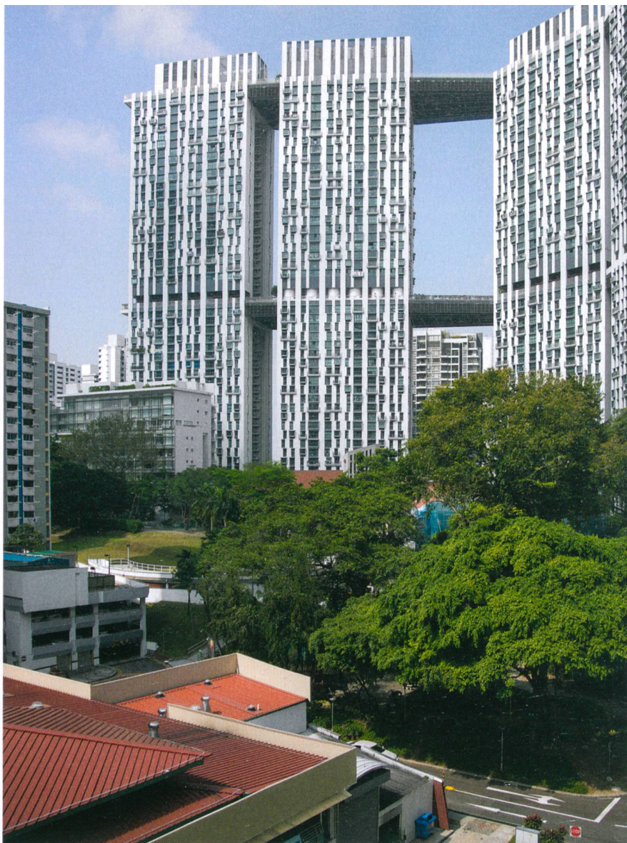
Im neuen Vorzeigeprojekt pinnacle@duxton verbinden zwei begehbare Plattformen die sieben fünfzigstöckigen Wohntürme.

In den letzten beiden Jahrzehnten wurde der allgemeine Lebensstandard deutlich angehoben. Das begünstigt eine immer stärkere Angleichung von HDBs und Condos. Unterscheiden sich HDBs der 1960er- bis 1980er-Jahre mit ihrem rohen Standardisierungsmodernismus noch deutlich von den wesentlich freier gestalteten Condos, werden jüngere HDBs ähnlich wie die Privatgebäude mit immer grösseren Glasanteilen an der Aus-