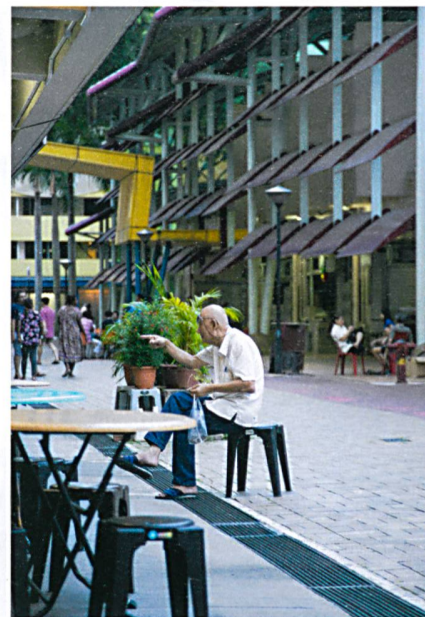
In vielen Hochhausblocks gibt es Läden und Esshallen.

Der staatliche Wohnungsbau war das vielleicht wichtigste Instrument, um die nationale Identität in der multikulturellen und vielsprachigen Gesellschaft Singapurs zu fördern. Das Erfolgsmodell HDB gerät jedoch in den letzten Jahren zunehmend unter Druck. Die Preise im Wohnungssektor steigen weit stärker als die Einkommen, was insbesondere für junge Familien, die Wohneigentum erwerben möchten, zu einer immer grösseren Belastung wird. In den Anfangsjahren wurden die Preise von HDB so festgelegt, dass sich siebzig Prozent aller Haushalte eine Vier-Zimmer-Wohnung und sogar neunzig Prozent eine Drei-Zimmer-Wohnung leisten konnten. Je länger, desto mehr begünstigt das Finanzierungssystem von HDB-Wohnungen aber gut verdienende, ältere Personen, die sich teilweise gleich mehrere Wohnungen kaufen können.