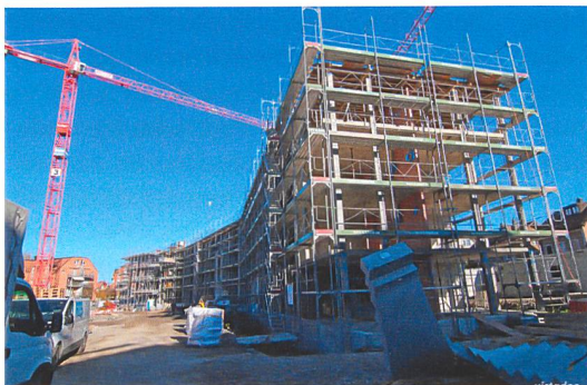
Ersatzneubau Stöckacker-Süd zeigt, wie es geht.

Wir alle wissen, dass sich unsere westliche Gesellschaft angesichts des heutigen Energie- und Ressourcenverbrauchs von rund 6000 Watt pro Person in Richtung 2000 Watt bewegen muss, damit wir zusammen mit allen Erdbewohnerinnen und -bewohnern in eine nachhaltige Zukunft blicken können. In diesen Begriff werden viele Erwartungen projiziert und es kursieren auch in unseren Kreisen viele Vorbehalte und Ängste, ohne dass klar ist, was das Bauen für die 2000-Watt-Gesellschaft konkret bedeutet.