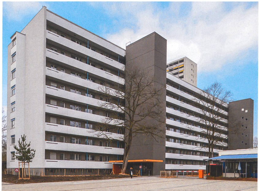
Die Ostseite blieb im Originalzustand erhalten. Hier baute man bloss die beiden Treppentürme von Grund auf neu.